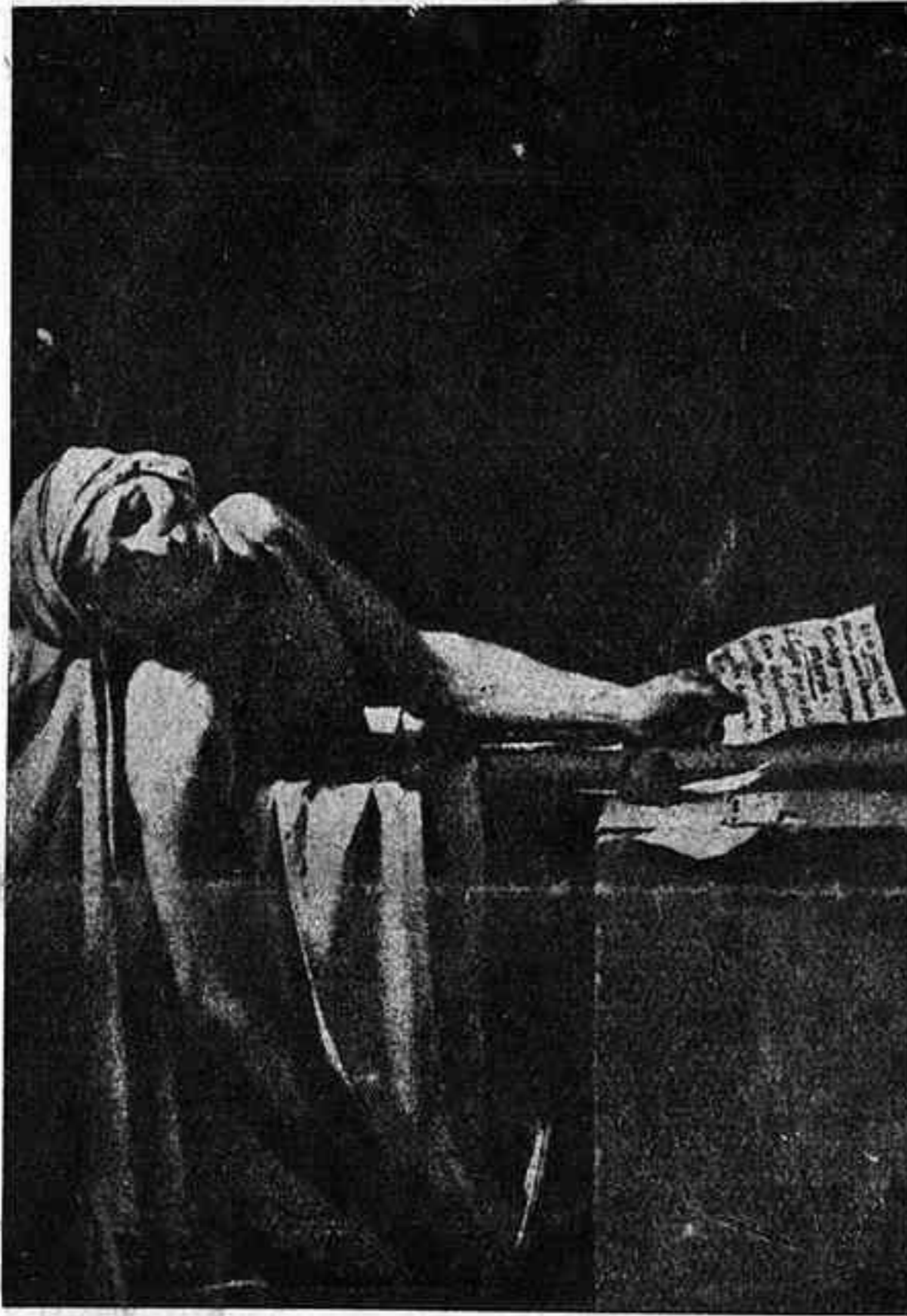
A. MARAT, SEGONS EL FAMOS QUADRE DE DAVID