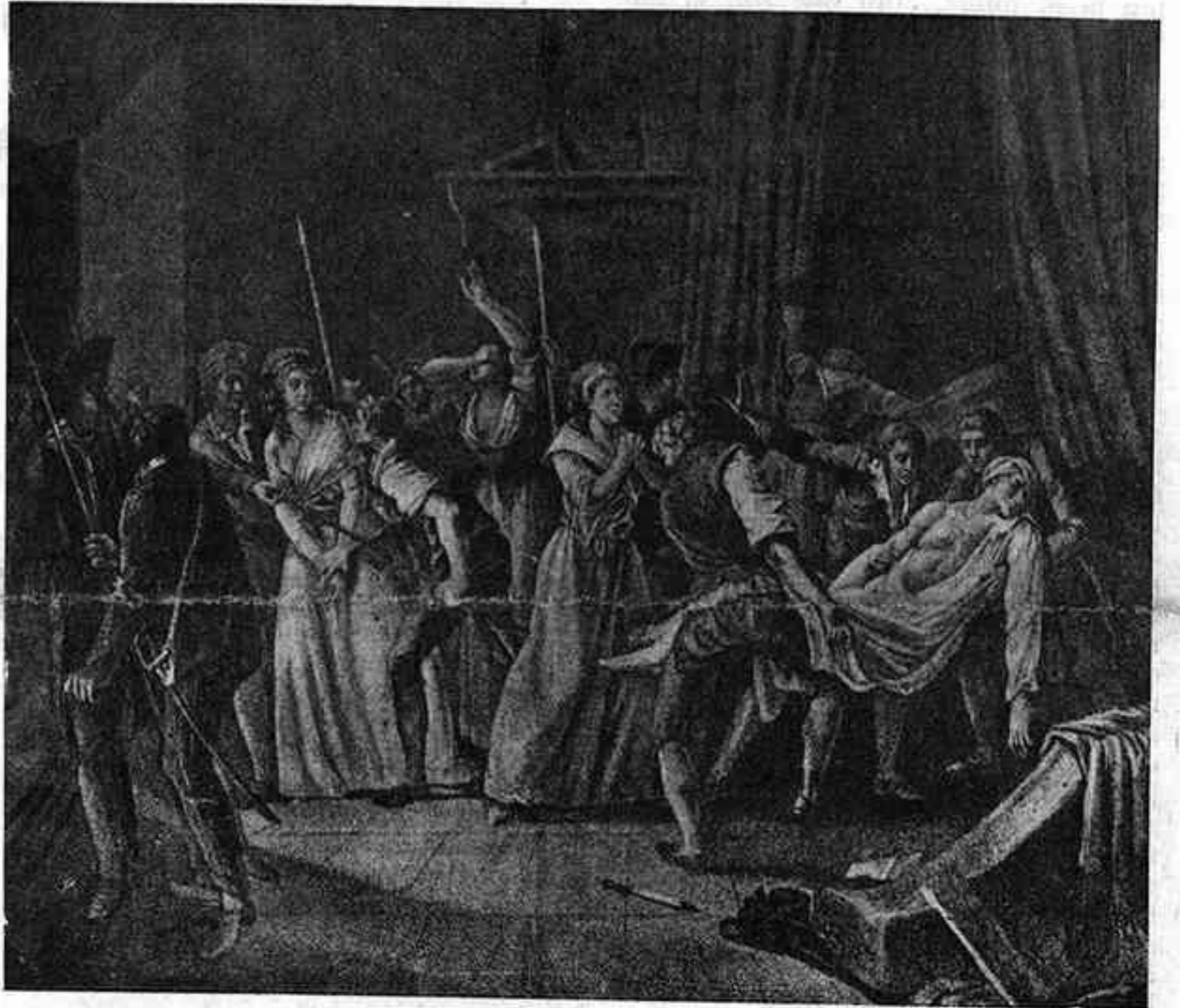
UN QUADRE ANONIM DE L'EPOCA ON ES REPRESENTA LA DETENCO DE CARLOTA CORDAY

bé mai desempallegar-se de la parcialitat, i, també, la pseudo-història, el més funest aspecte d'aquest corrent sentimental.