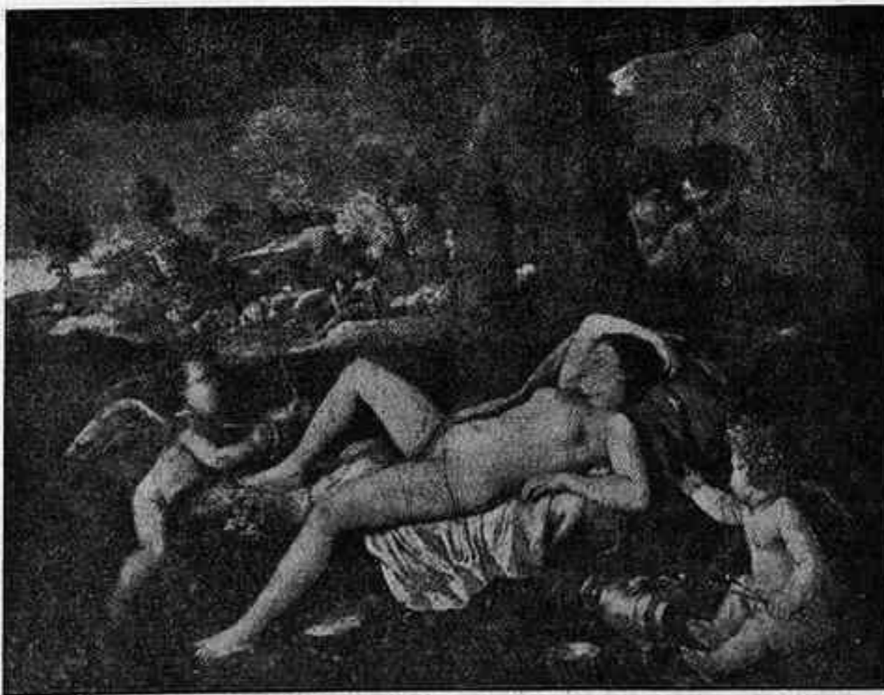
POUSSIN. VENUS DORMINT