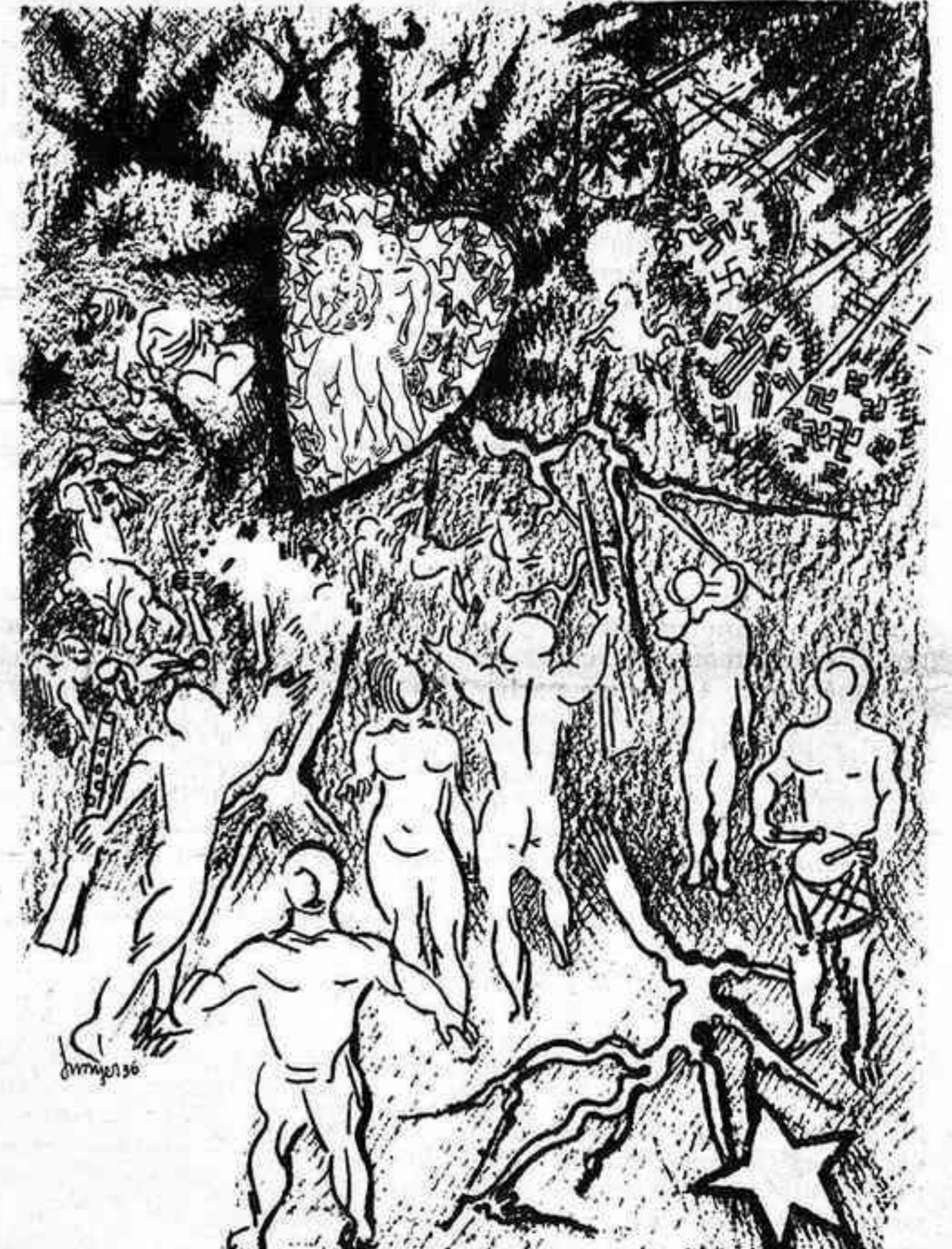
JOAN JUNYER. IL·LUSTRACIÓ AL POEMA DE RAFAEL ALBERTI «DEFENSA DE MADRID»