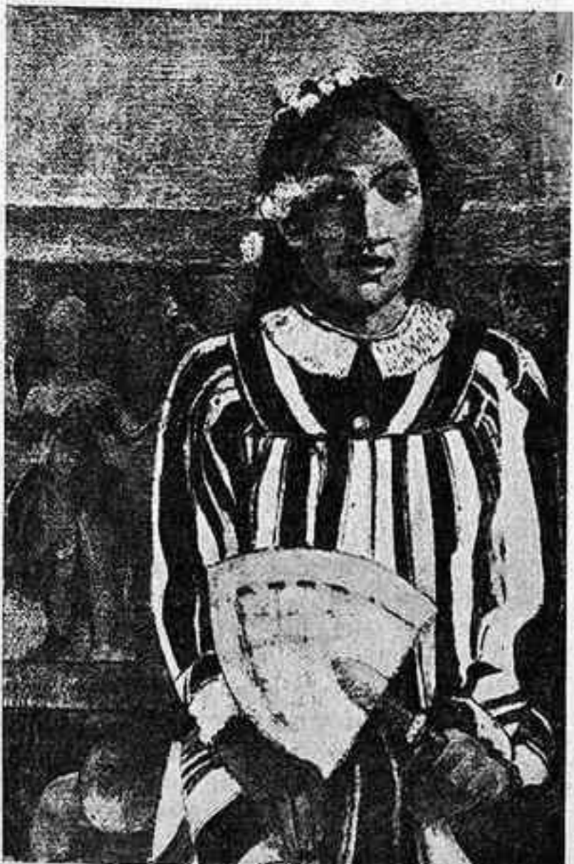
GAUGUIN. DONA DEL VENTALL

Més de mig segle ens separa del començament del moviment impressionista, i aquesta distància històrica ens