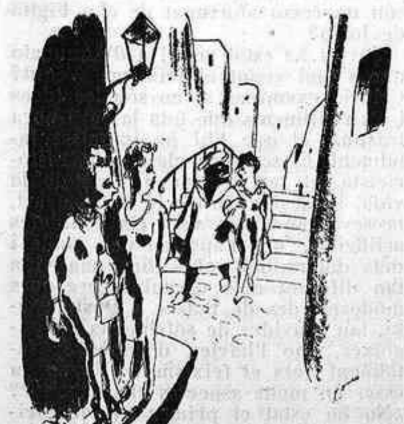
AL CAMP FACCIÓS

—S'ha donat de baixa. —Com que és metge, tota la vida farà el mateix: altes i baixes.