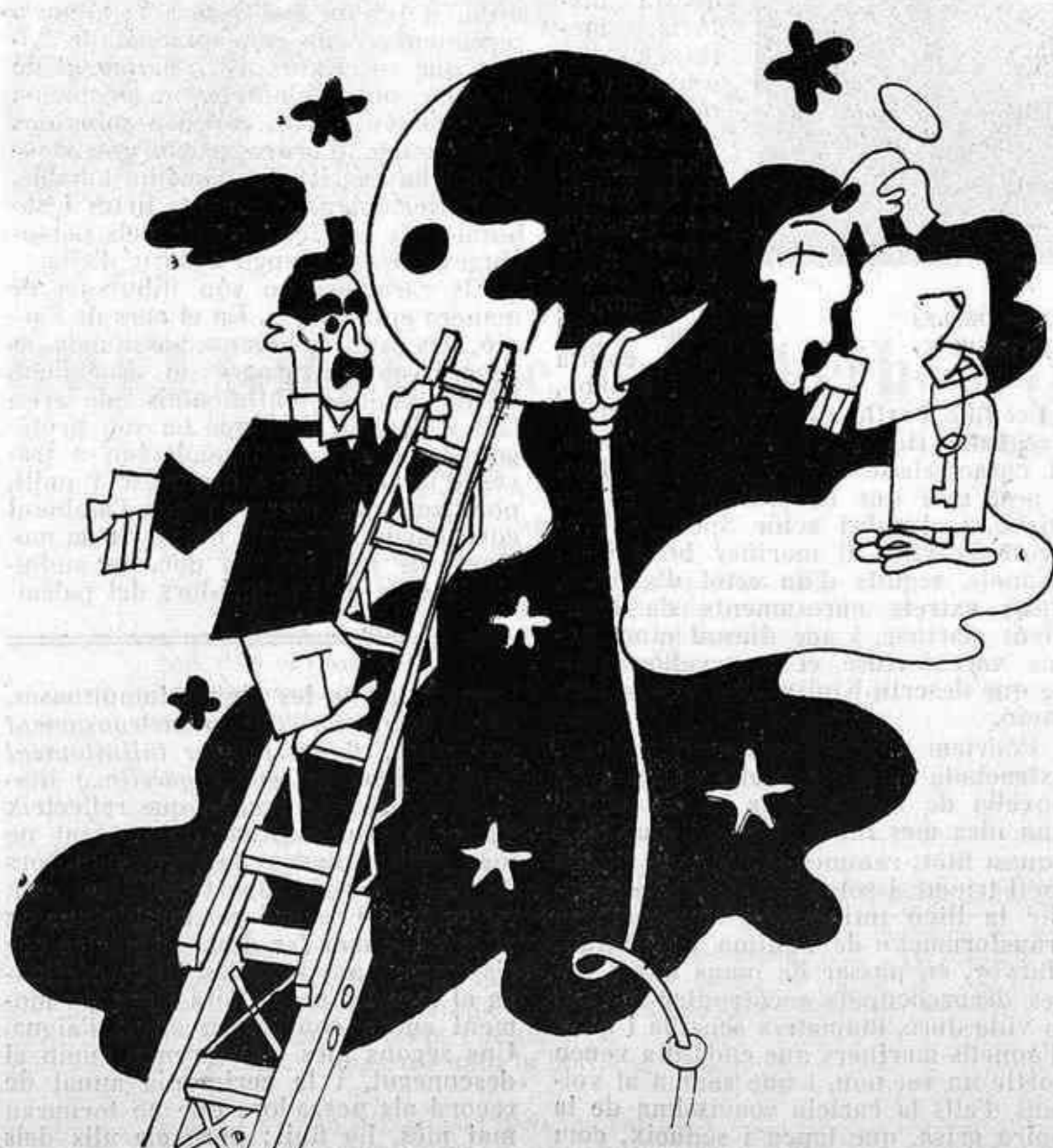
PAU I PERE, PER GUASP

Una damiseha de cabell platinat, acaba de sortir d'una perruqueria ostentant una flamant i novella permanent. Un admirador seu — amateur en sintaxi germanòfila, potser? — amb ganes d'enlluernar-la més encara, li diu a cau d'orella, amb estudiat èxtasi, el següent adjectiu: —Lentiplàsticocromocolielèctricoserpentigràfic!!!