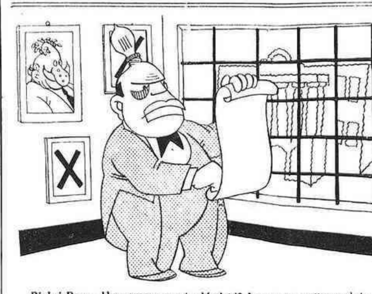
Pich i Pon. - Un nomenament a Madrid? Ara sí que estic perdut.

En Romanones ha sortit a la carrera de monarquies.