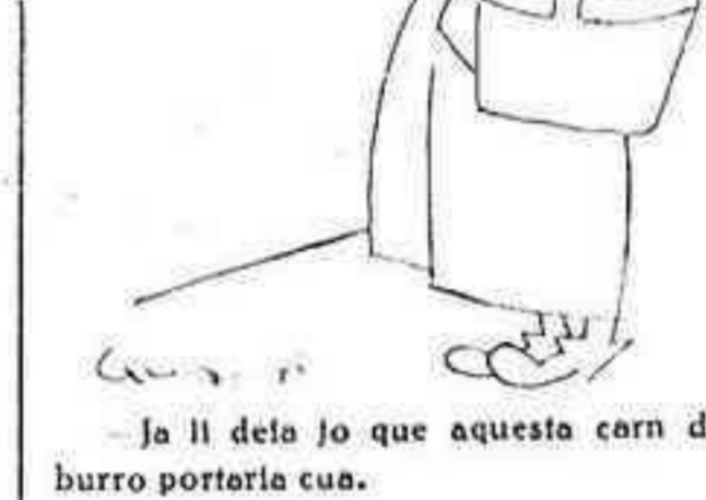
-Ja li deia jo que aquesta corn de burro portaria cua.

Des que don Pere Coronines freqüenta els establiments del Paral·lel per documentar-se en vistes a una producció literària, el diputat Fontbernat és trobat sovint en els mateixos establiments que freqüenta el seu superior.