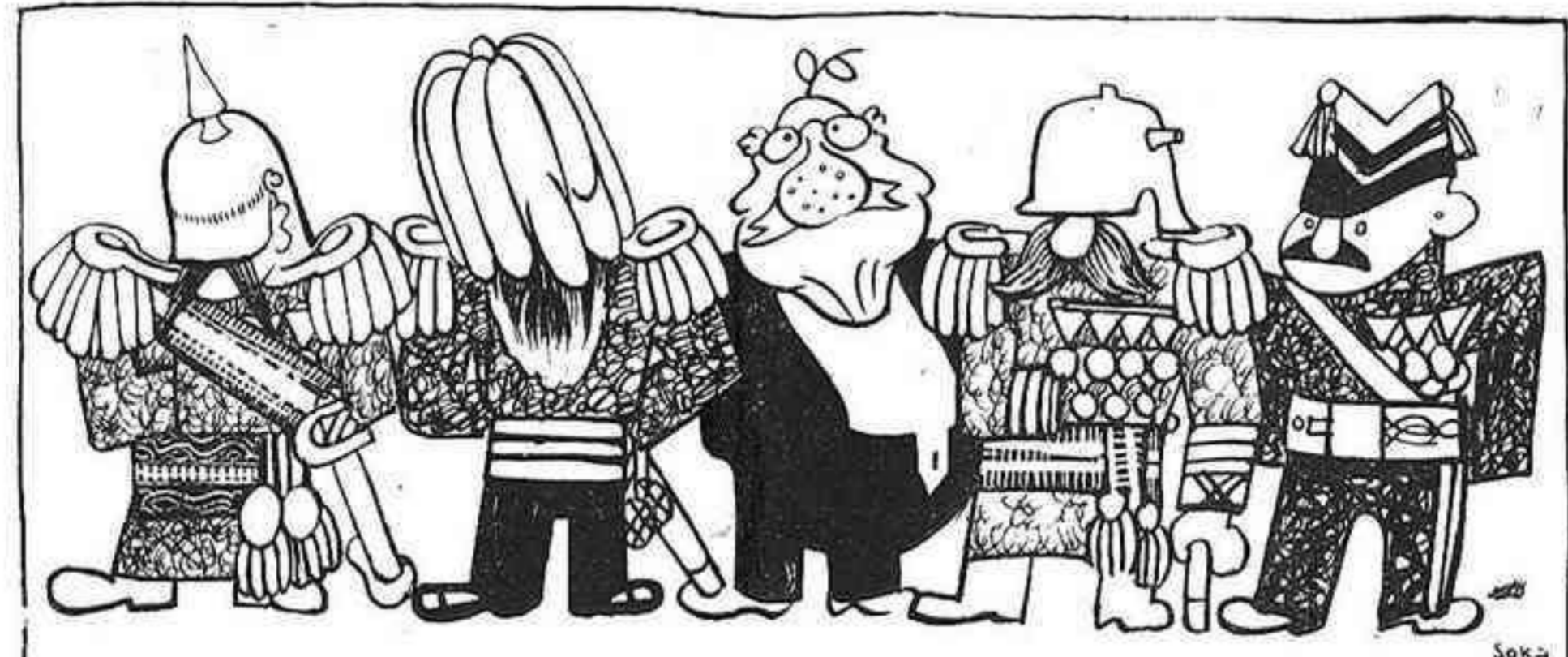
- El pròxim Govern Lerroux.