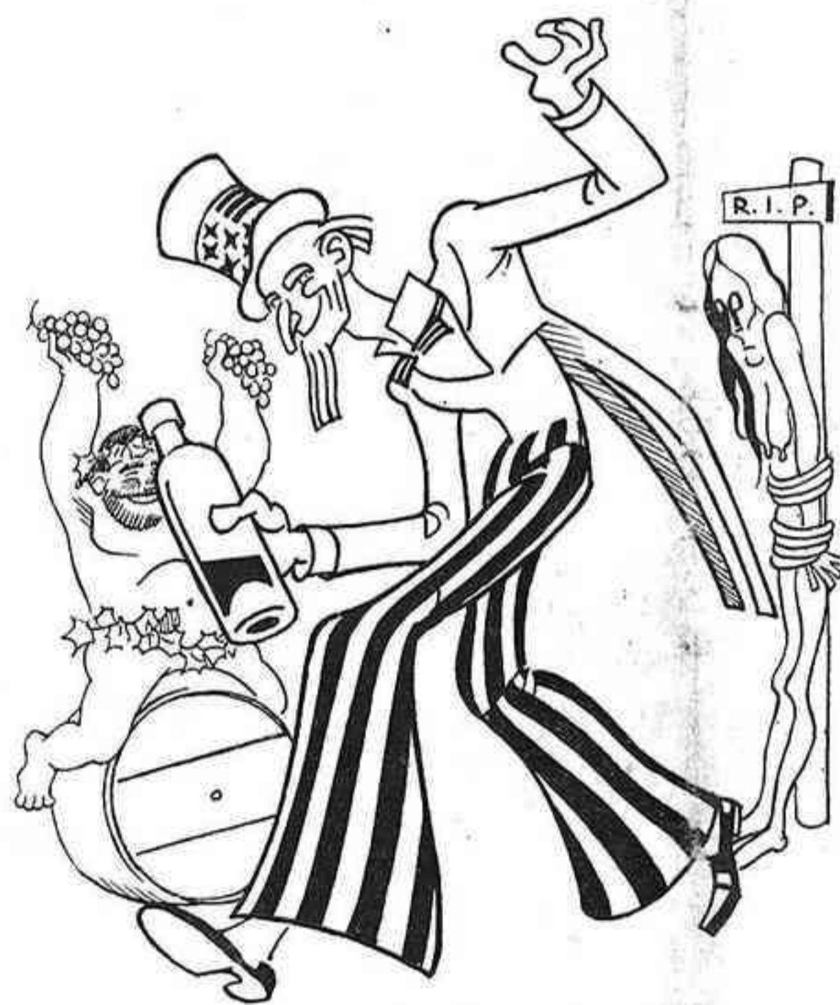
L'ONCLE SAM A setzel A setzel A setzel el vil que la pobra llei seca s'acaba de morir.

—Així, la cosa és un fet? —Yo no digo esto. Es posible que sea un hecho, pero es posible que con toda la preparación no resulte más que agua de borrajas. Pero no importa. Usted sabe perfectamente que en esta vida, para llegar a viejo hay que hacer todos los papeles de la aleluya.