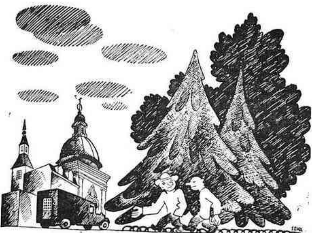
—Després de la vista de la causa, veurem els efectes.

Però és que encara hi ha més. Hom veu anunciat a les carnisseries i als mercats un tros que ja per si sol fa ruboritzar: el pit i cap de costella. Però, si només aparegués el nom a la vista del públic! Podria considerar-se el ròtol com una novel·la pornogràfica i, simplement, confiscar-lo i detenir la carnissera. Però és la cosa! És la cosa mateixa la que s'exhibeix al públic amb tota la impudícia. I aleshores, què fer? Possiblement les autoritats es trobaran perplexes dabant d'aquest problema. Nosaltres creiem que no és per a tant, i que la cosa és ben clara: cal considerar les carnisseries que facin aquestes exhibicions com a simples music-halls del Paral·lel: multa a la primera; clausura de l'establiment a la segona i obligar les carnisseries a l'ús de sostenidors.