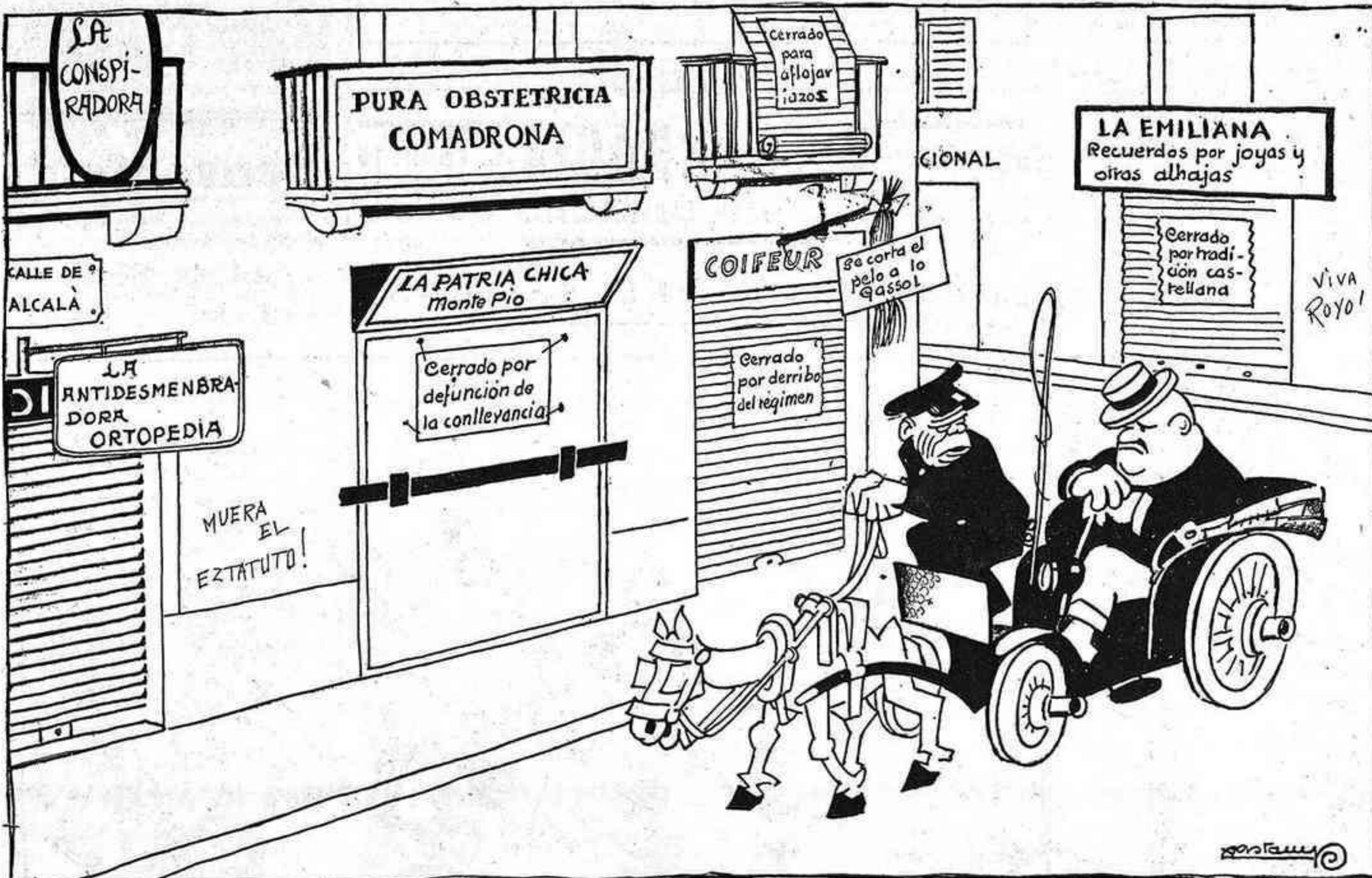
DIMECRES A LA TARDA, A MADRID — Tot està tancat?

«El Progreso» de diumenge publicava el següent titular a tres columnes: LA CALUMNIA SE HA HECHO ANTILERROUXISTA. Heus ací una nova baixa a registrar en els pataquejats rengles del Partit Radical.