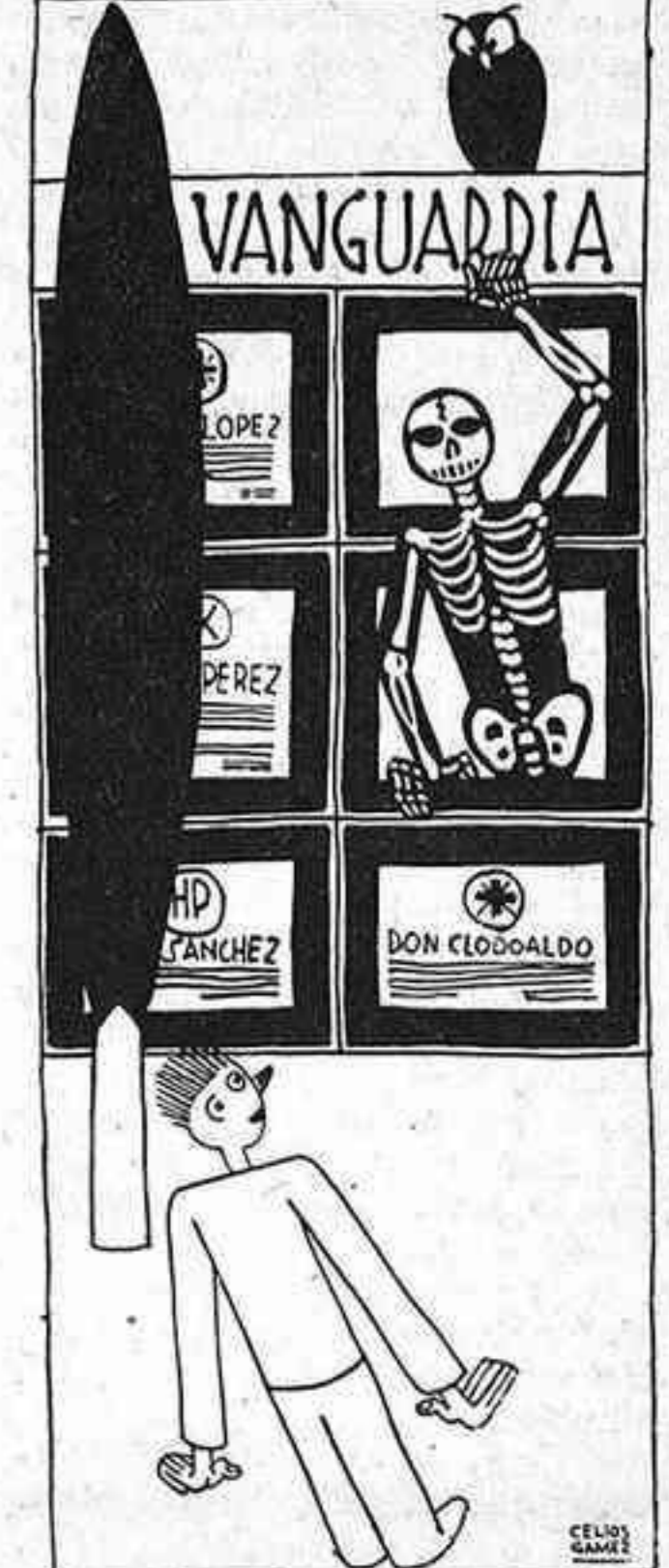
—¿Tants anys de callar i ara surts amb aquests brams? —És que em fa por que m'apliquin la llei de fugues de capitals.