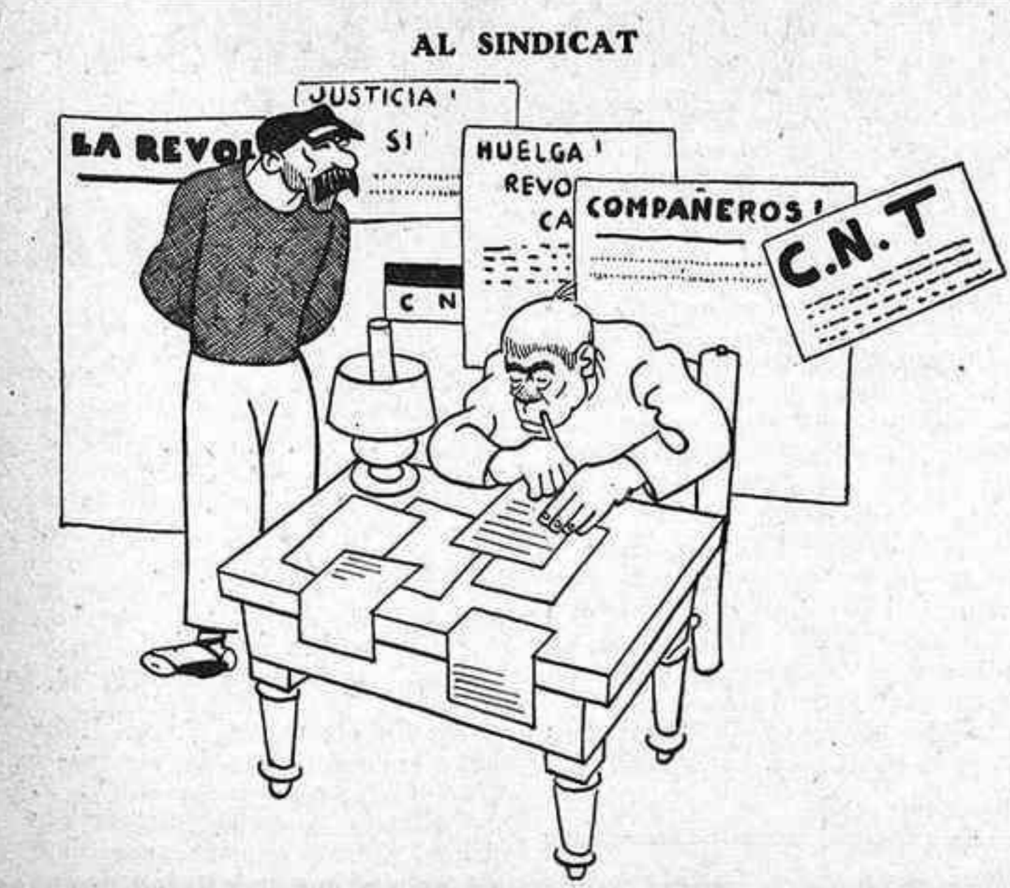
—Que no plegues? —No, encara haig de decretar catorze vagues, redactor sis manifestos i proclamar divuit revolucions. —Com et deixes explotar! A veïem quin dia us declarareu en vaga, els empleats del Sindicat Únic.

—No pugis pas a dalt—van dir-li—. Els escamots estan molt escamats amb el vostre article d'avui i et volen fer un cap nou. En Ferrer, naturalment, obté per l'actitud prudentíssima de guillar cames ajudeu-me. Gràcies a això, no ha mort un altre Ferrer, i no a mans de les panteres de la reacció, pre-cisament.