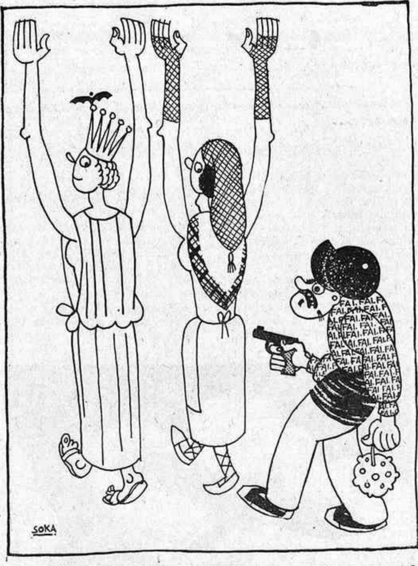
—Que ha de durar gaire, això d'anar amb els braços oberts?

En aquest punt, una mena de bramul com d'una mar en tràngol, va sentir-se; tot s'anava entenebrint i... ens despertàrem amb mal de cap i una cama en rampada. Tot no havia passat d'un somni; perquè, en la realitat, si la F. A. I. mai fos victoriosa, no creiem que es manifestés tan benèvola.