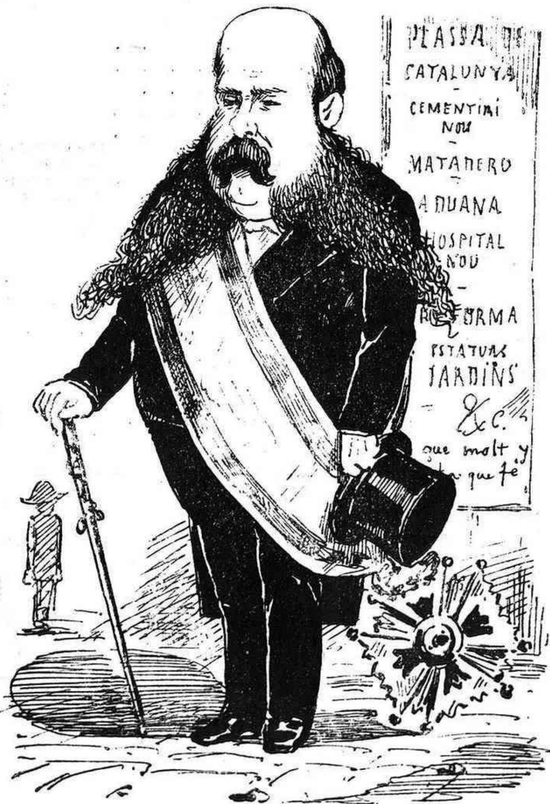
Sr. Alcalde mayor, Ya que le han dado una cruz; Emprenda Vd. las reformas Y haga luz, luz, mucha luz.