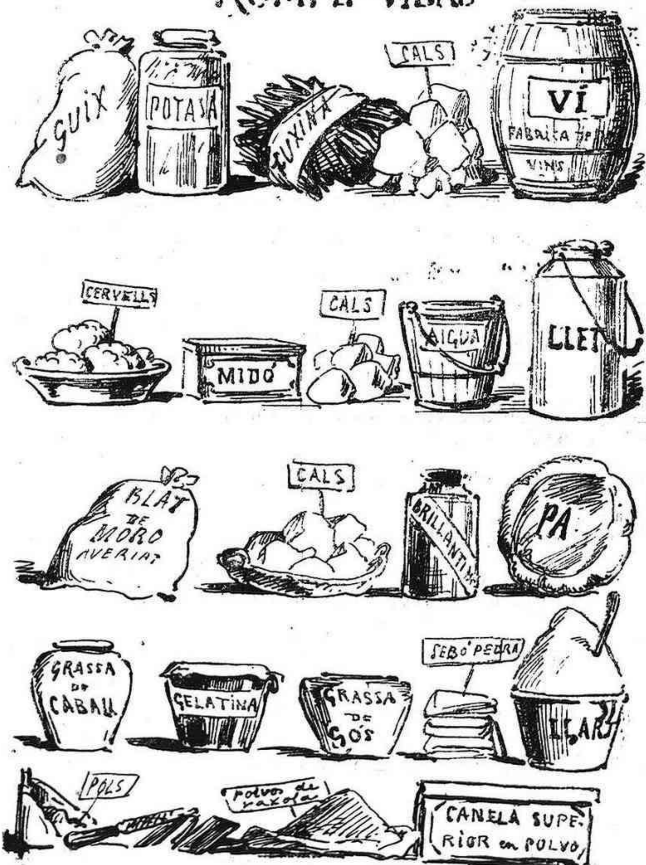
Medis d' envenenar al públich de Barcelona. Tot aixó ataca l' estómach del públich y la vista de las autoritats.