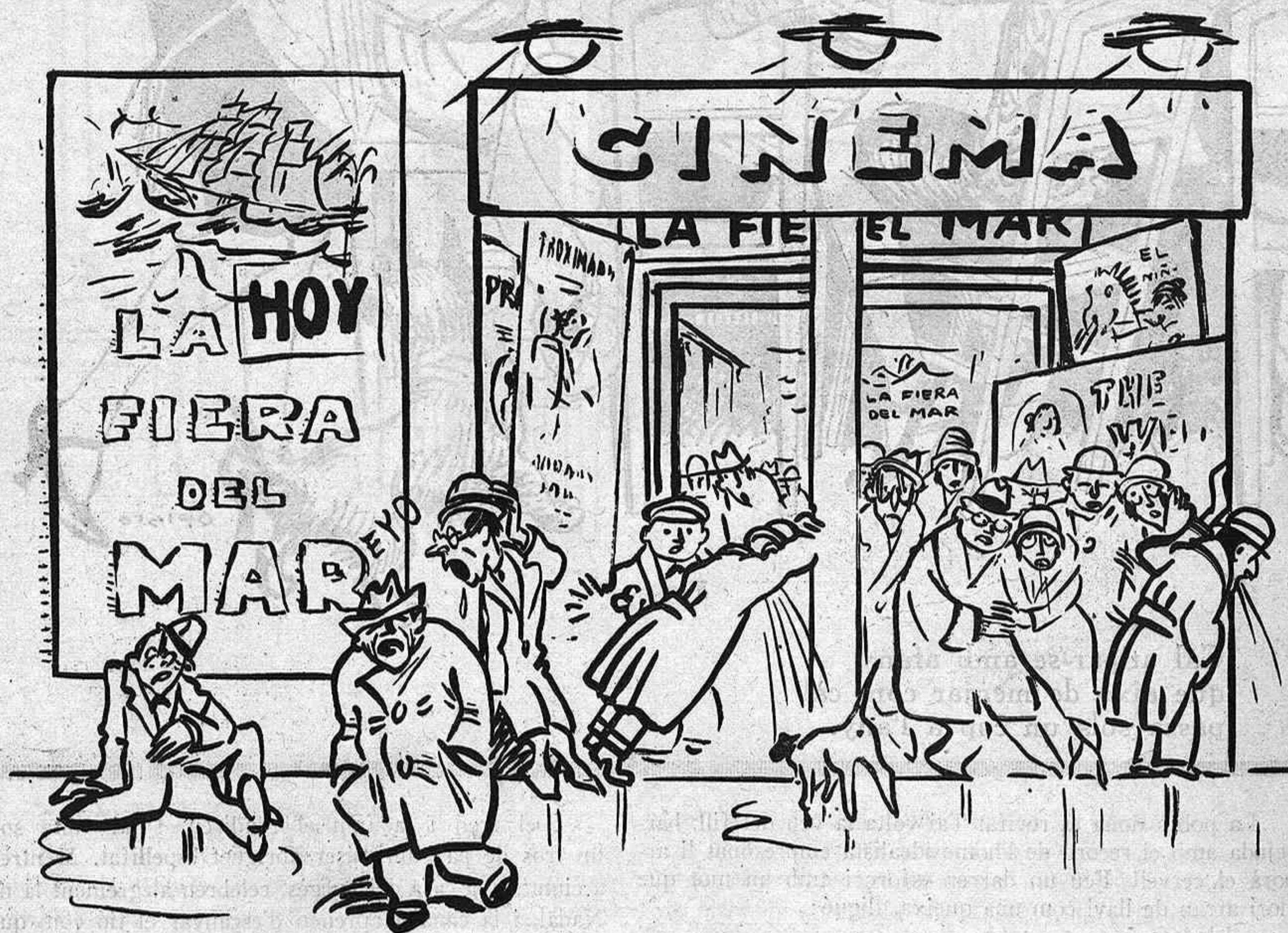
LA PEL·LICULA DEL DIA

S'anuncia el debut del baríton Alessandro Bonci.