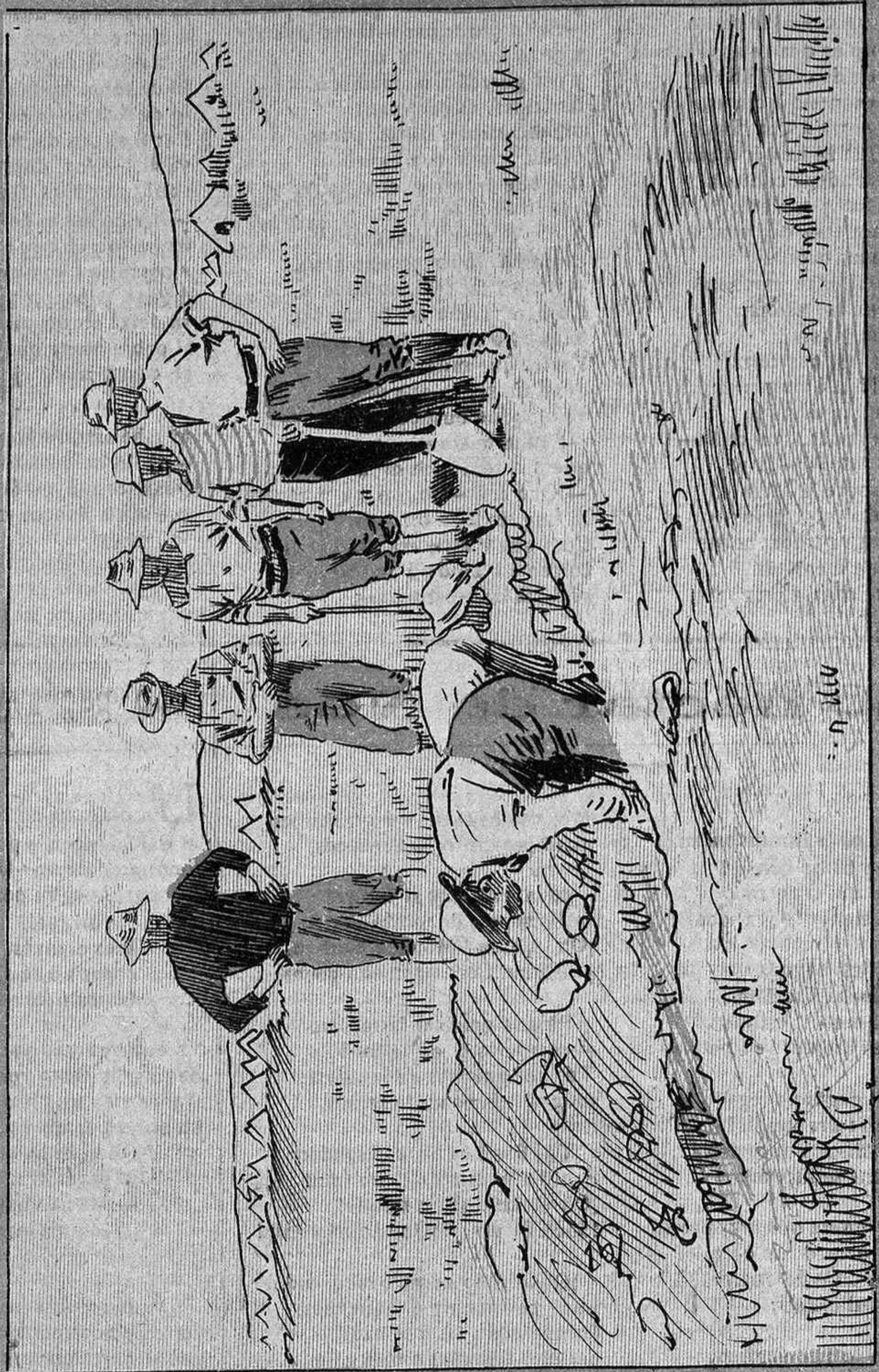
Inglesos construint una trinxera.