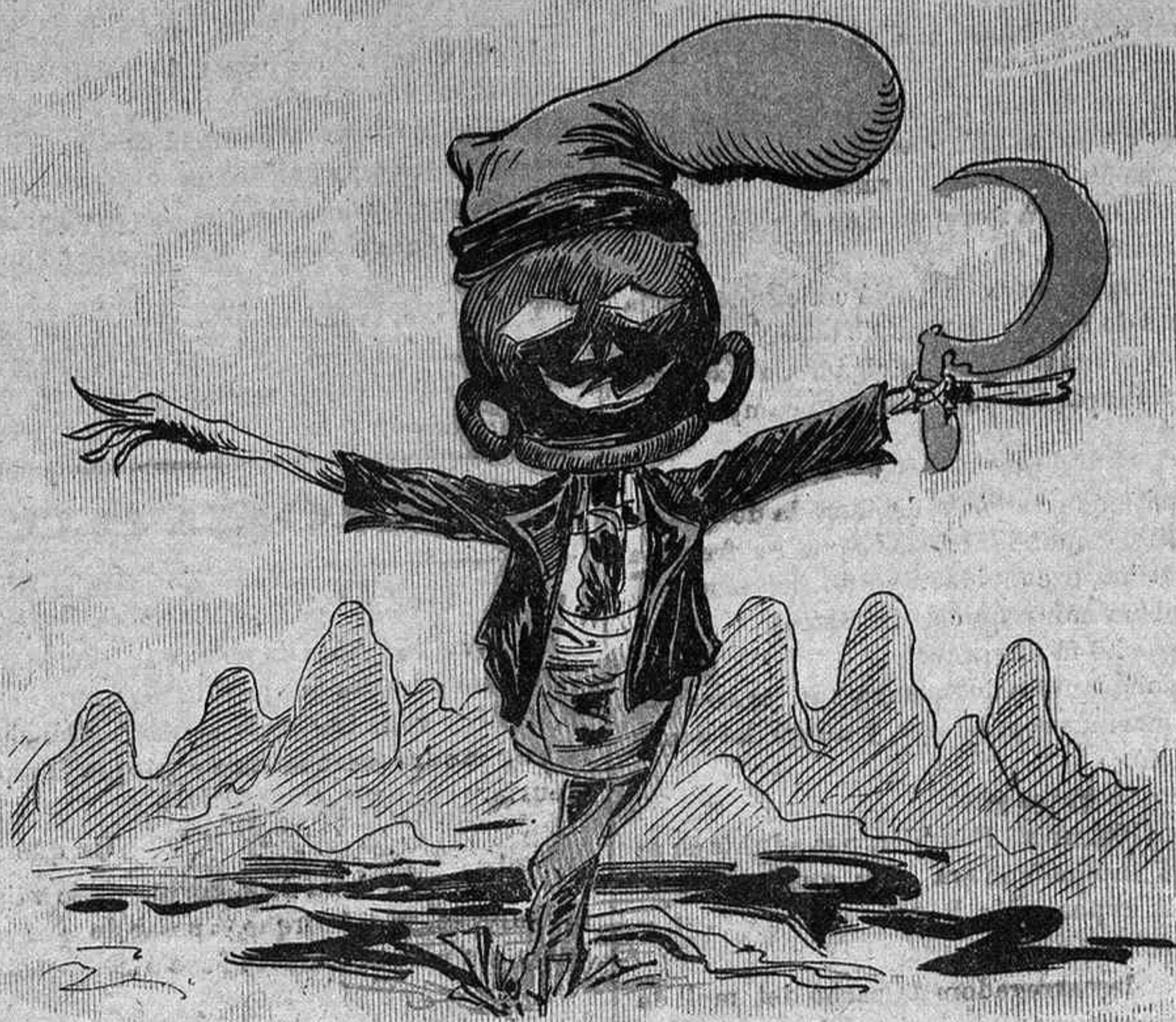
La monomania d' en Romero.