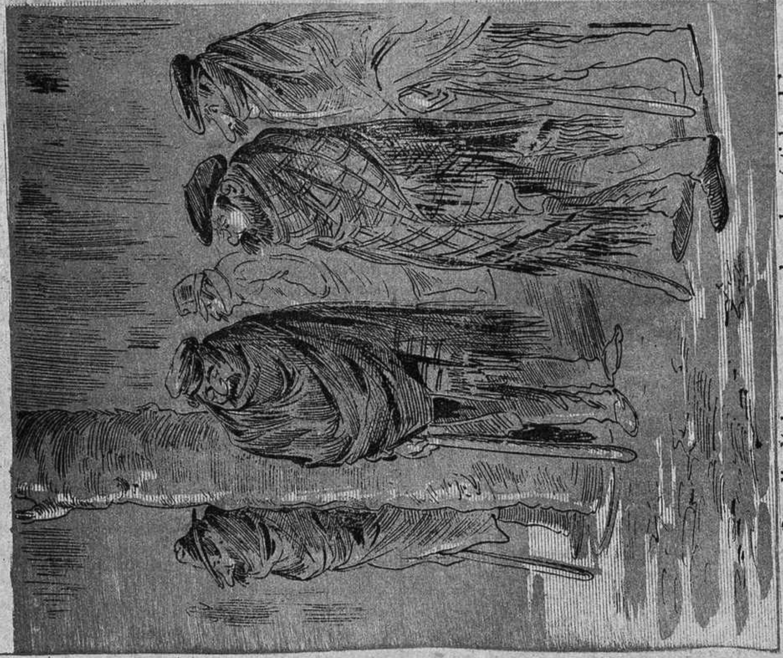
Guardia d' honor escampada pels pórtichs del Liceu, durant la present temporada de concerts á càrrech del Orfeó.