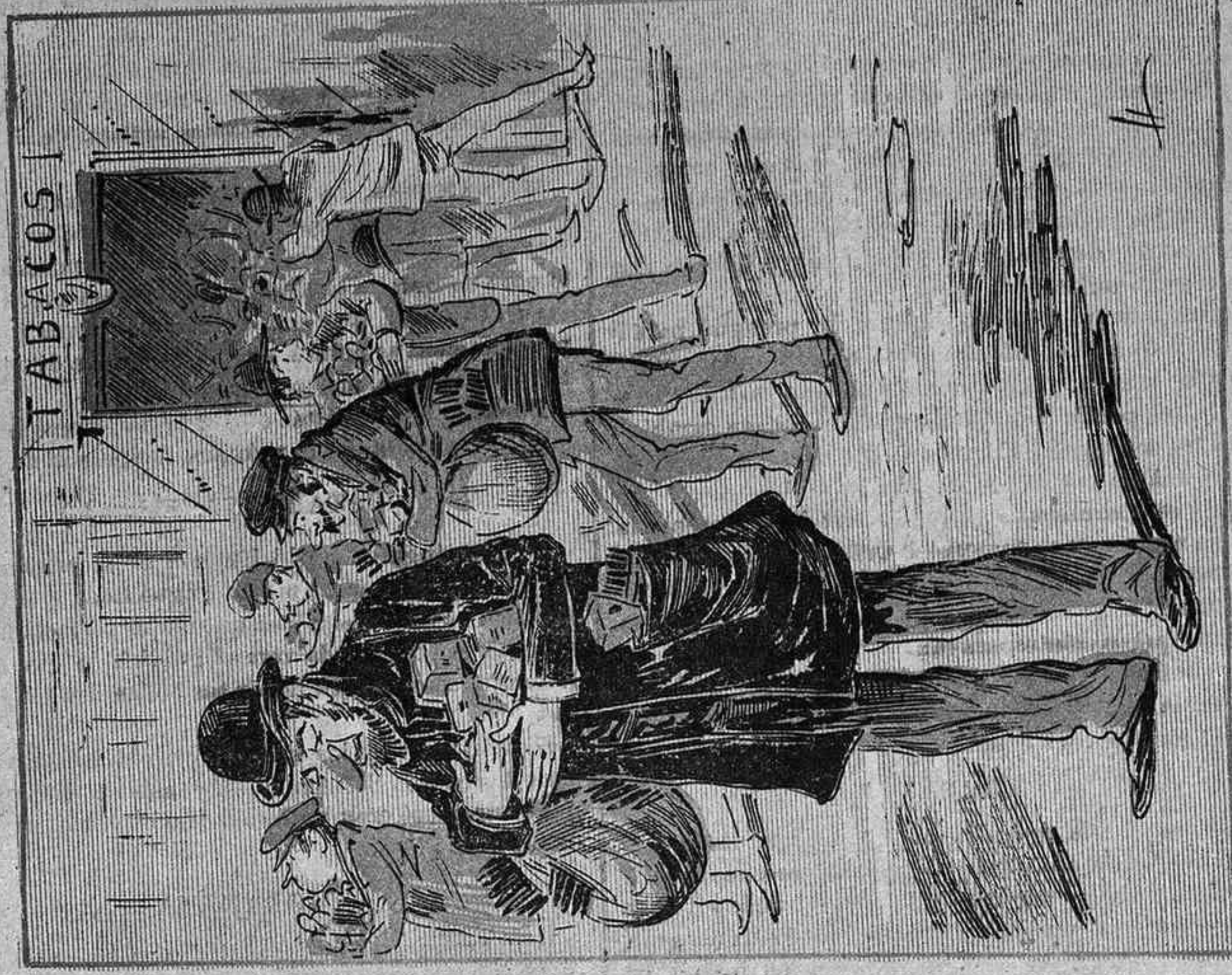
Els aficionats al suc de la nicotina, fent saca en els estanchs, en previsió del augment anunciat per l' Arrendataria.