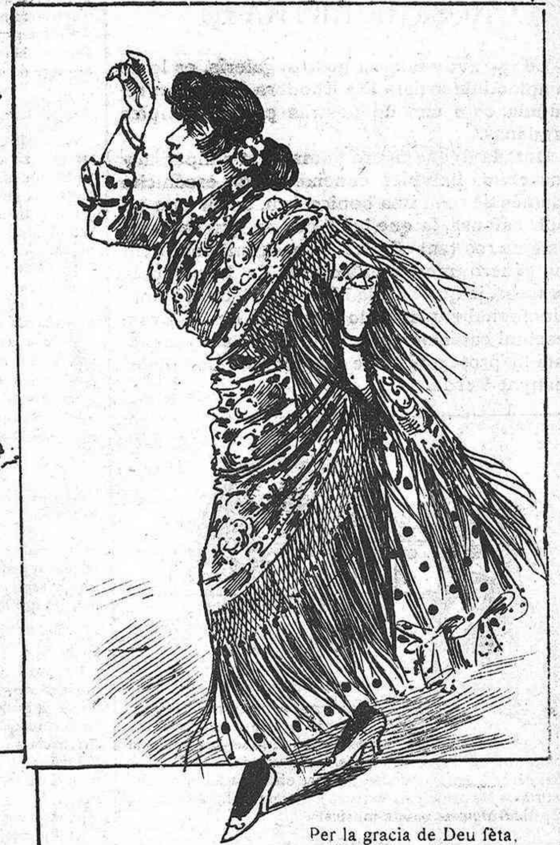
Per la gracia de Deu fèta, era salada hasta allí. Pobre Petral... va mori de malaltia secreta.