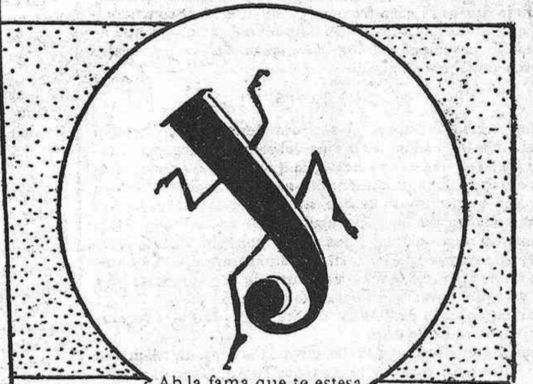
Ab la fama que te estesa será sa gloria inmortal; viva la gracia y la sal de la jota aragonesa.

Japa-ja-já, Japa-ja-jí; mora que de tant ballá al últim 's va trencá sense poguerla afegí.