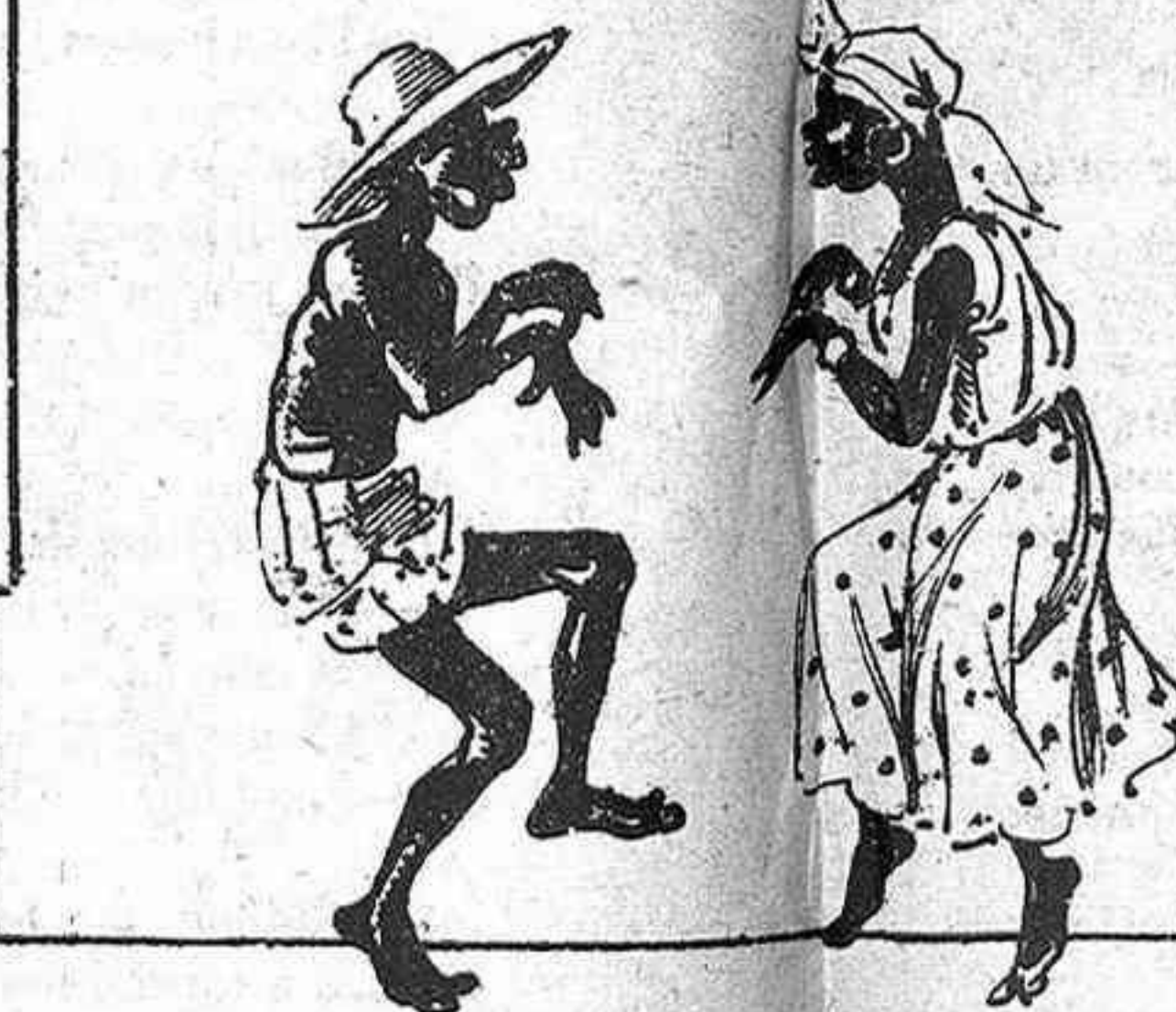
Ab mes goma qu' un elástich aquets dos sembla que volan: