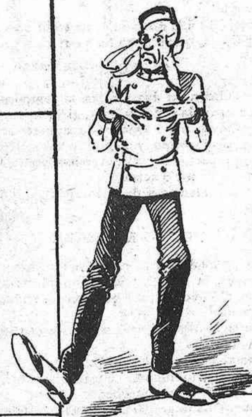
Per mes qu' es morin ballant, Inglesos sempre n' hi haurán.