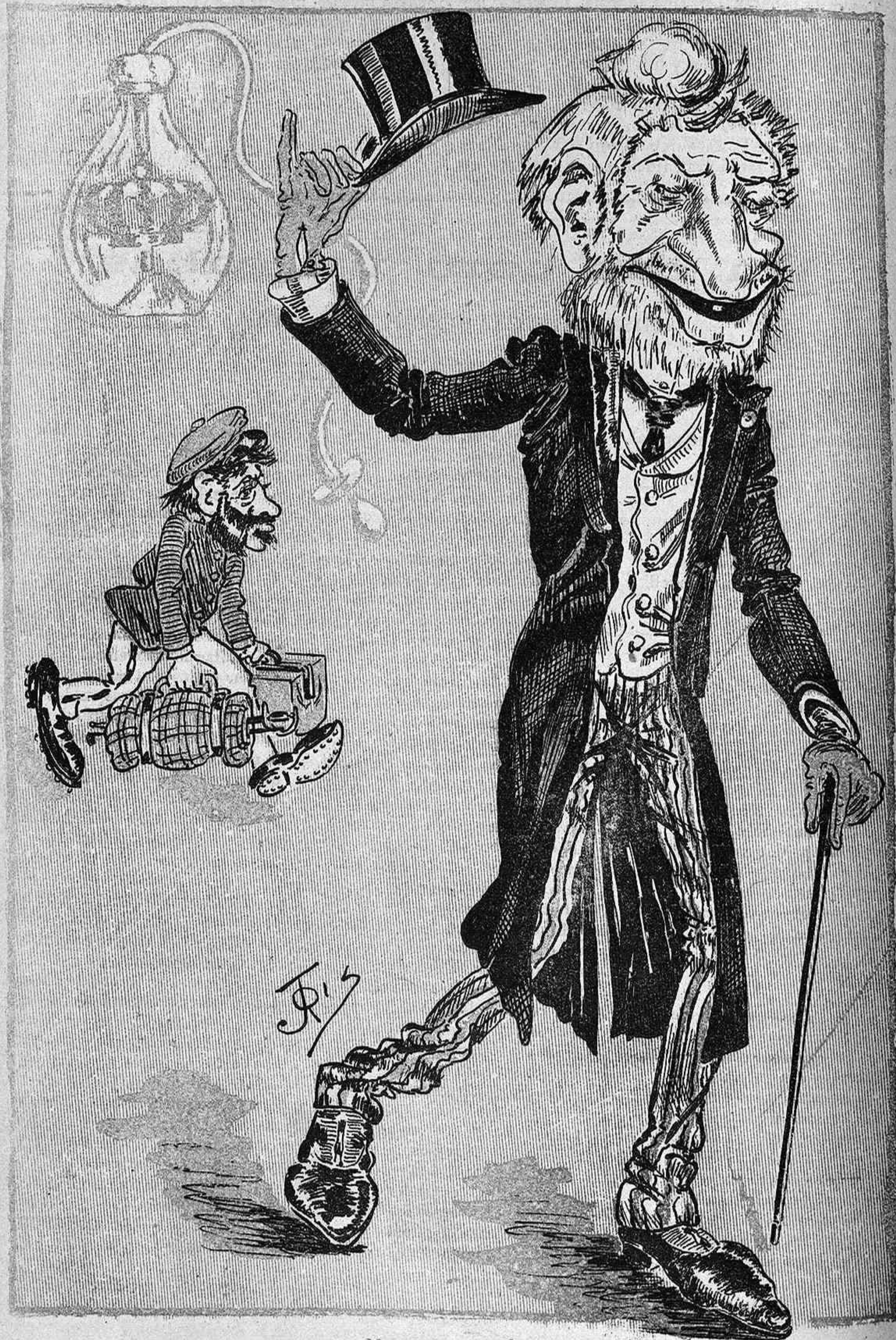
Mentre 'ls altres estiuejan per lo Nort, el Vell Pastor s' entreté aixecant infundis y rifantse á tot lo món.