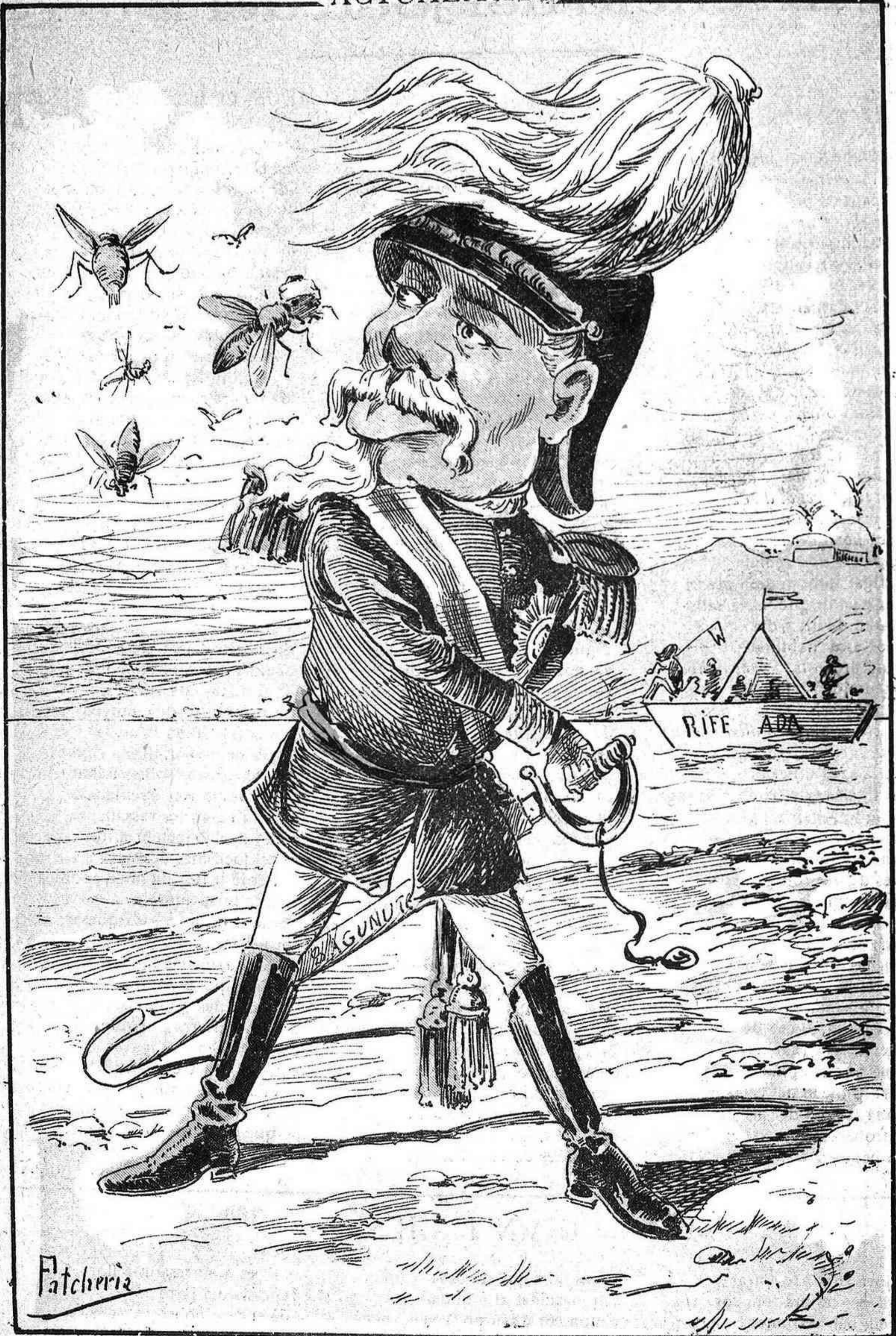
Al primer qu' agarro dihent que se me 'n han riat... me 'l menjo.