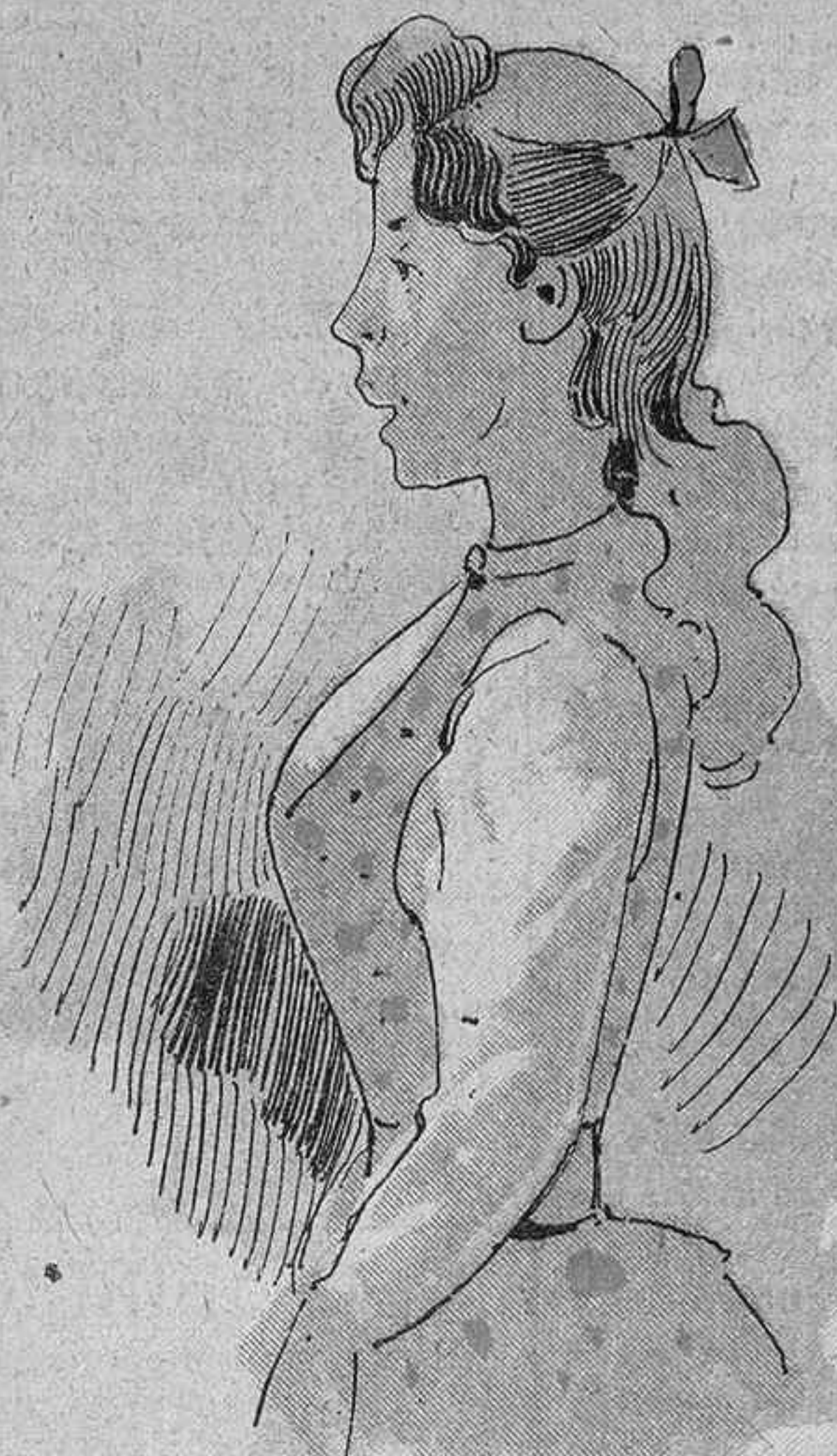
—Ab aquesta distracció de focs, tothom està fret . La nostra feyna no vol soroll.