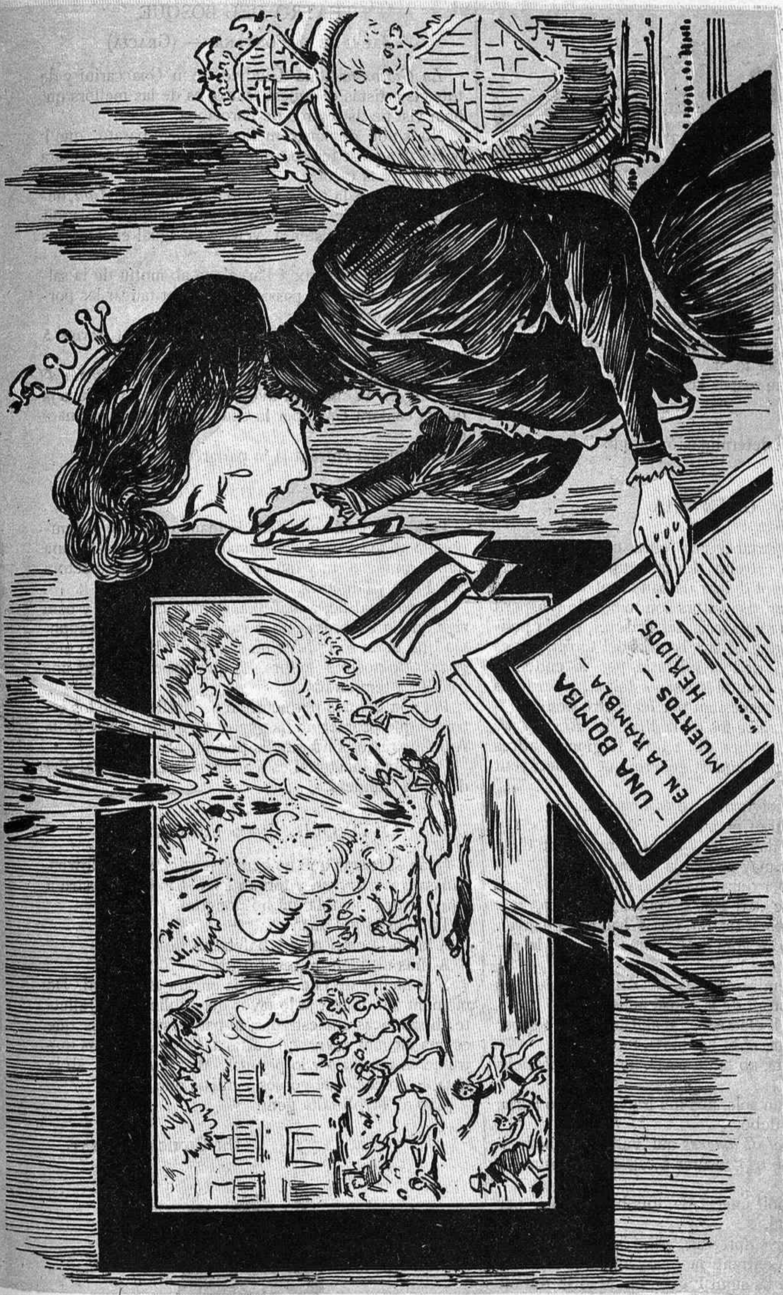
Altre volta Barcelona plora llàgrimes de sang... ¡¡ Sigán sempre maledidas las fieras que 't fan plorar! ¡