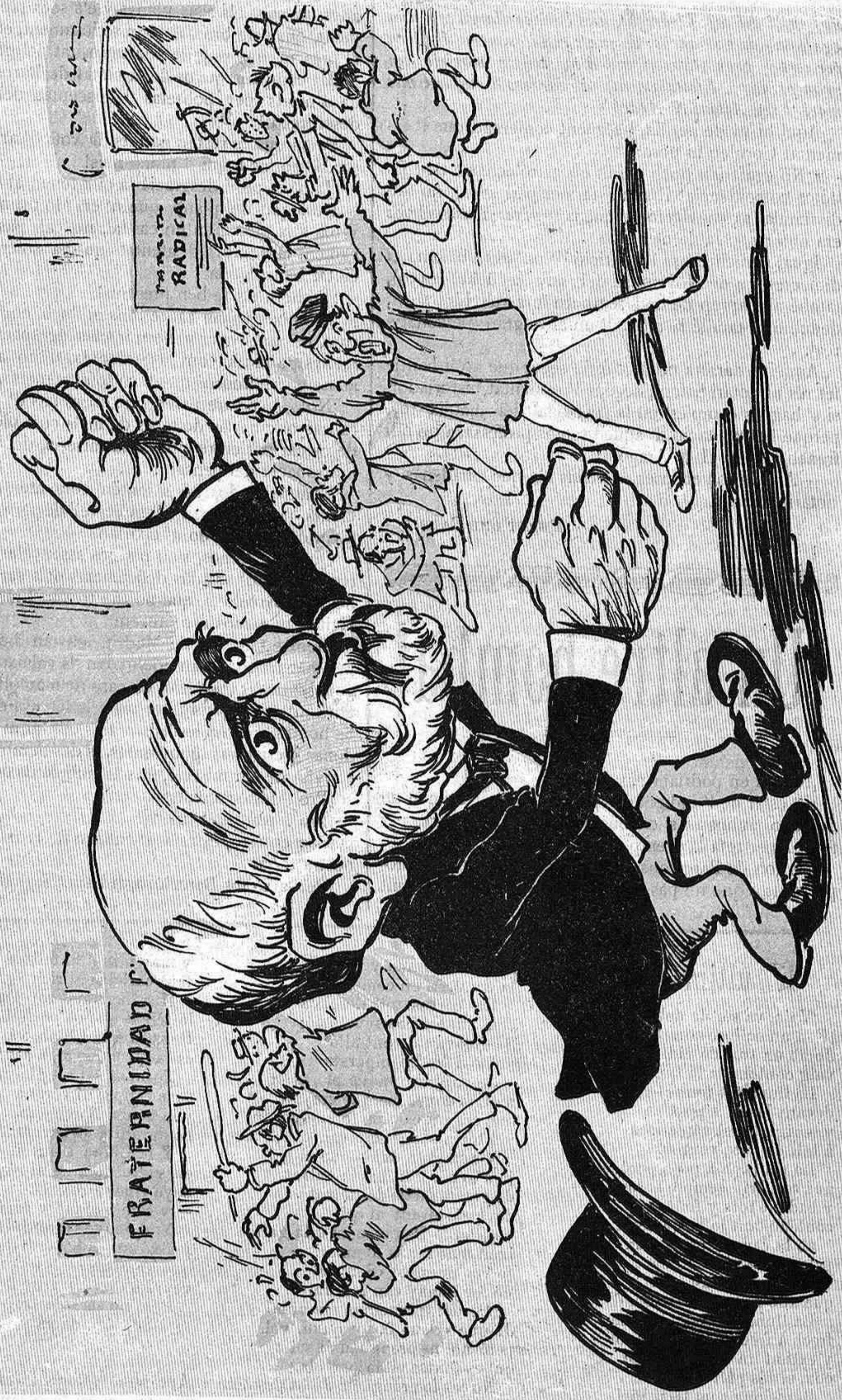
Don Nicolás s'impacienta perque trova que 'ls soldats en lloch de discriminar