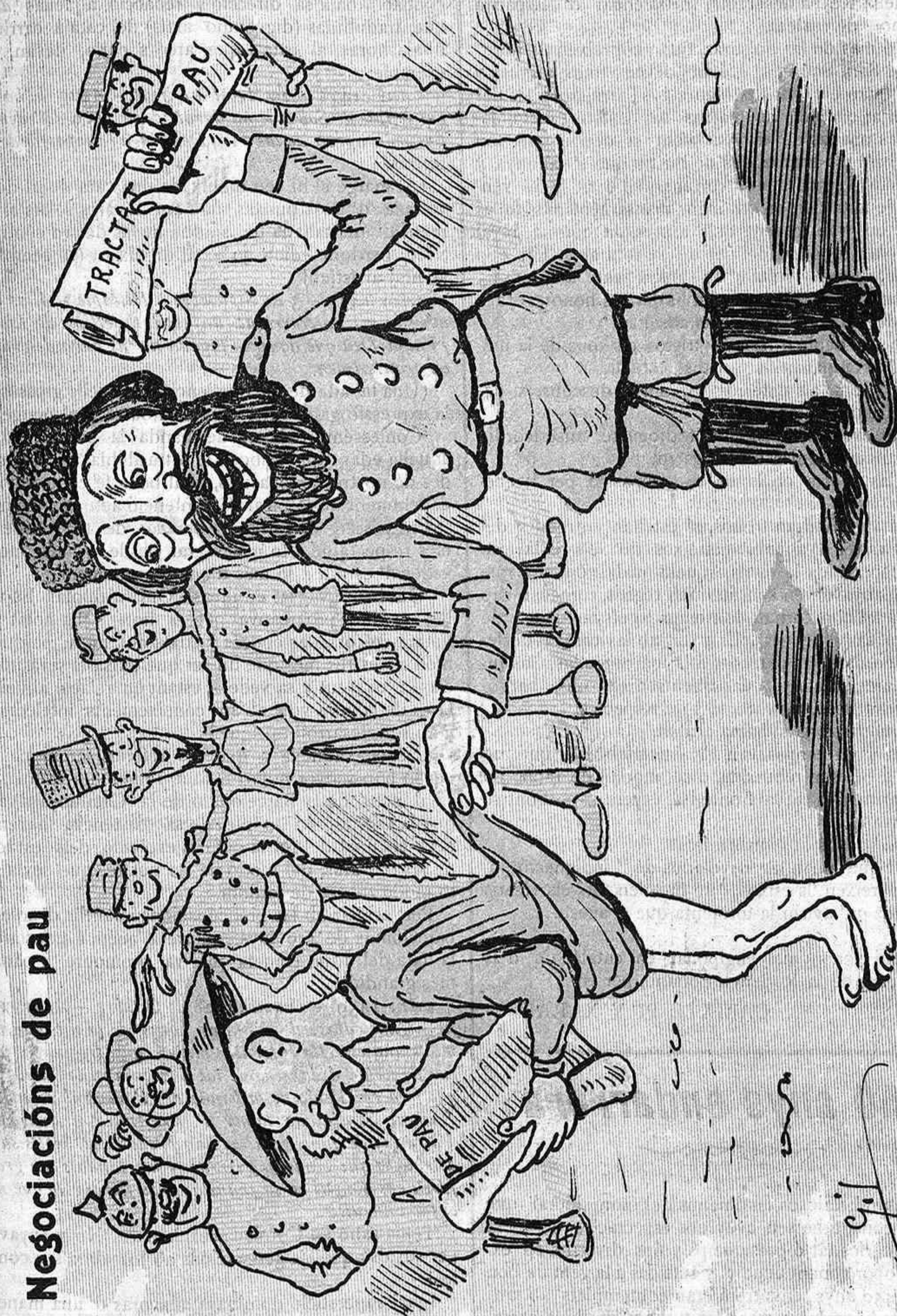
La única victòria russa.