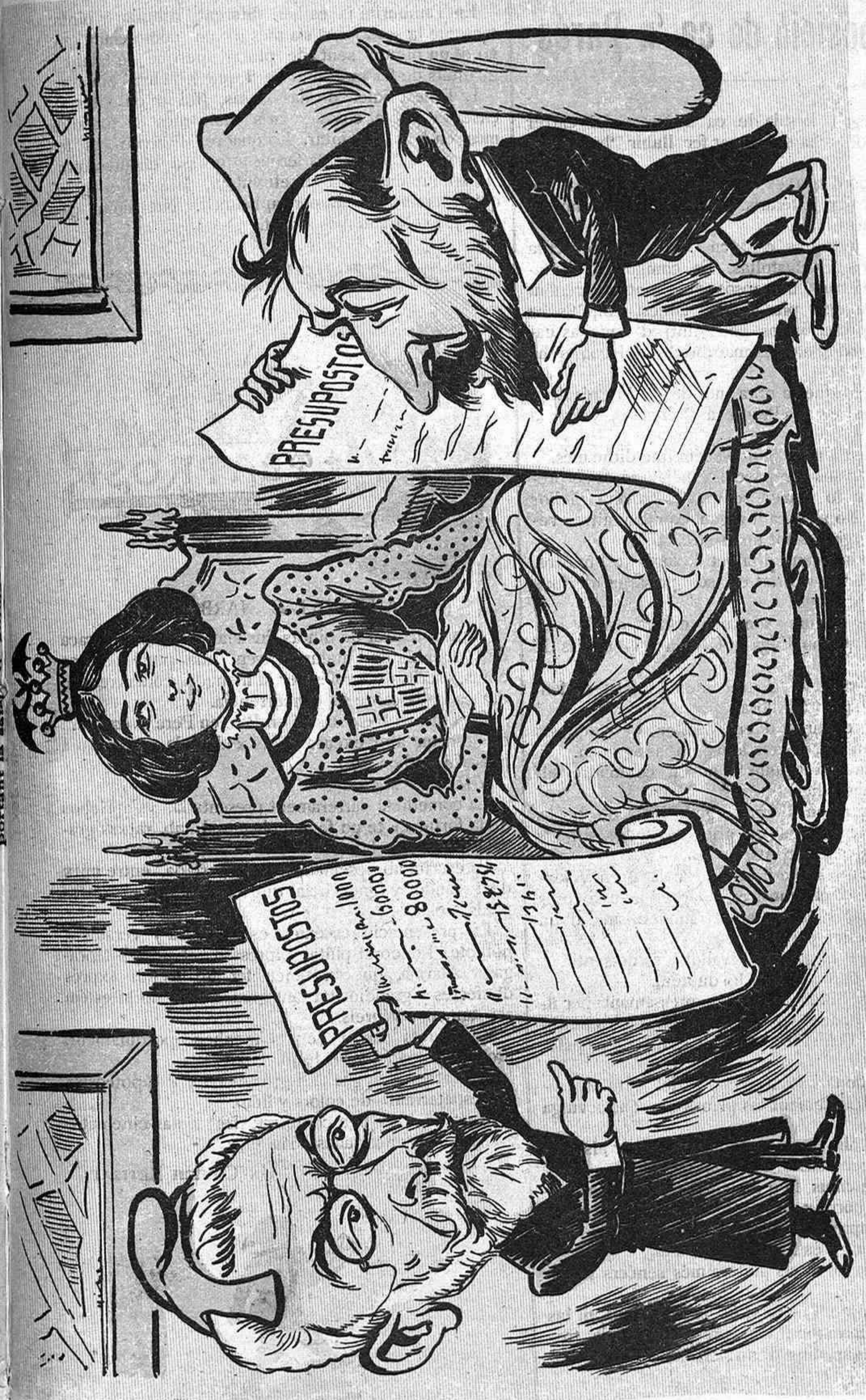
Dos dècimes aquest any presentan a la Pubilla : lo antich, ab remedos mascles , lo nou, de la majoria.