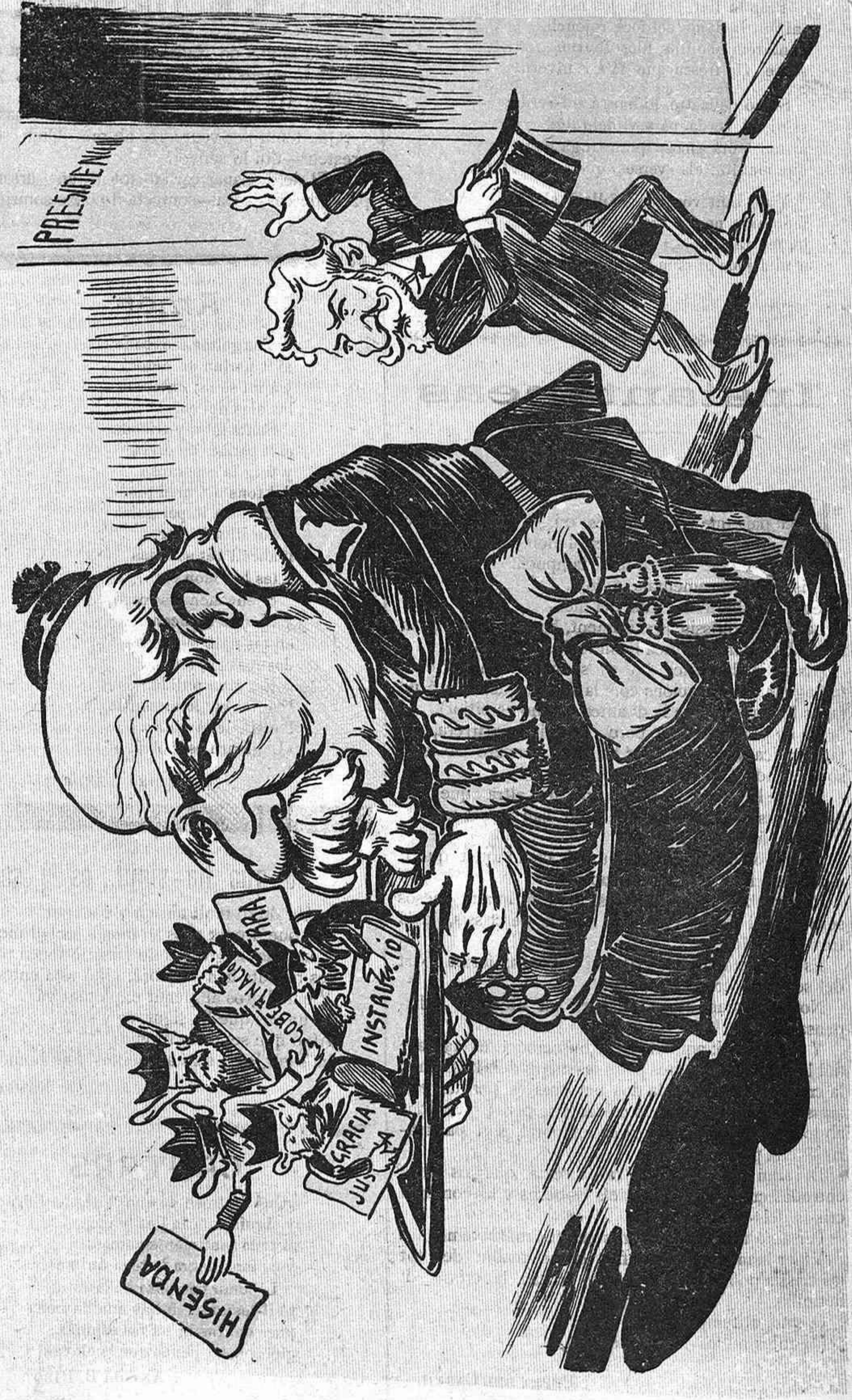
Aquí tenen indicat d' aquesta manera gràfica i sagristà President portant la tray d' animals