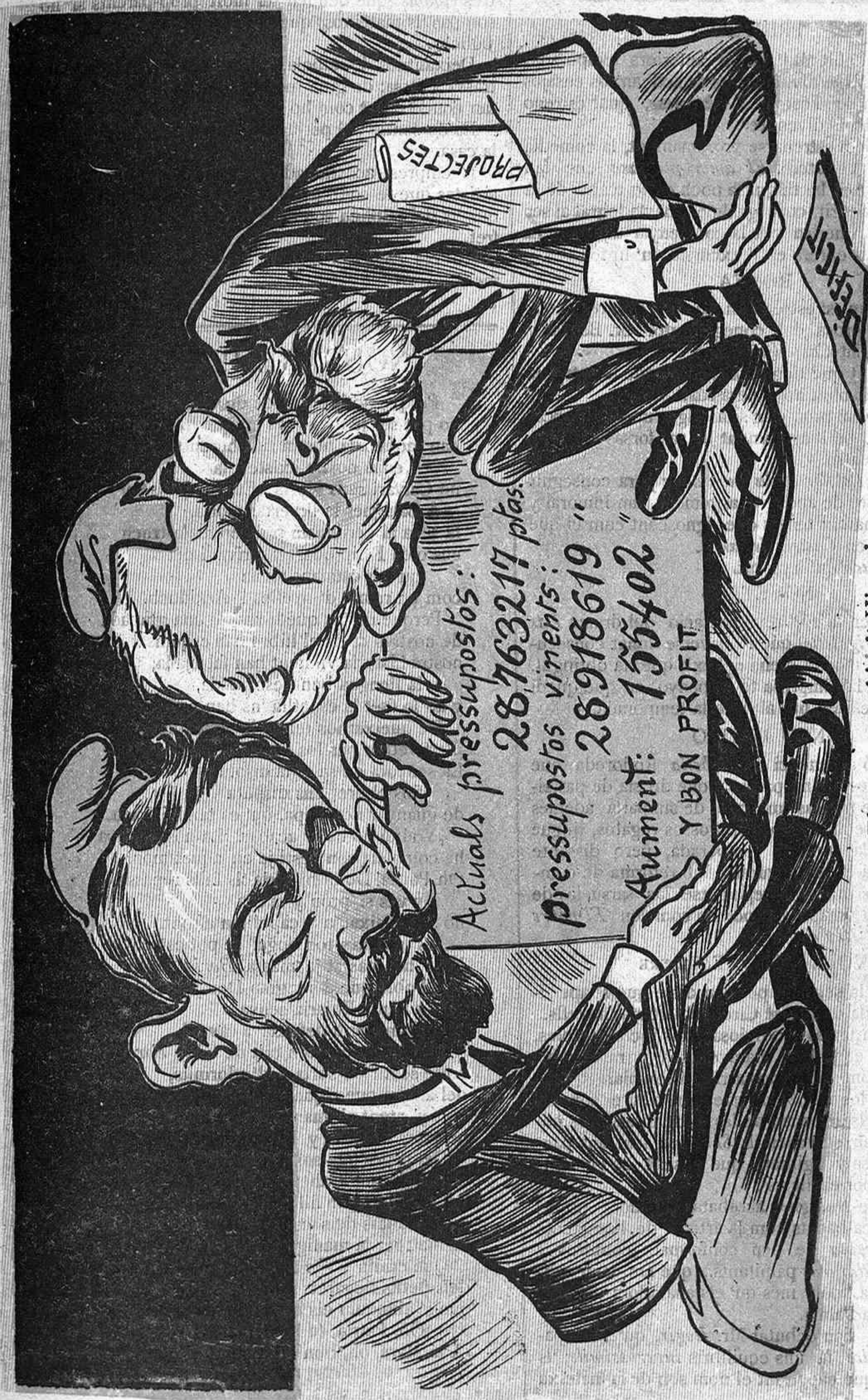
Els nostres sabís d' Hisenda per fer rica à la Ciutat, han tingut un part difícil y are dormen descansats.