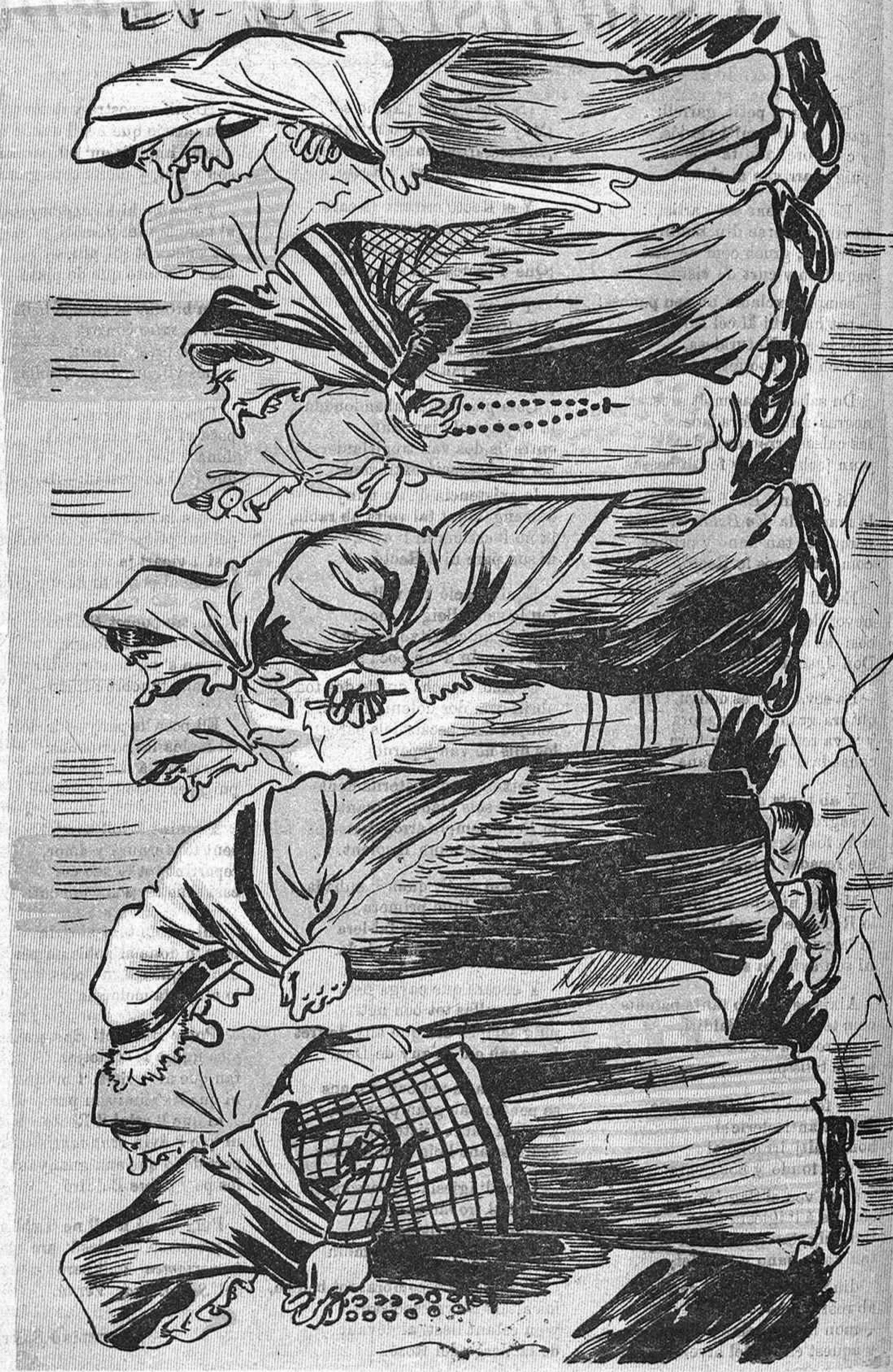
Ab veus de canya esquerdada pe 'l carré anavan cantant: l' home á casa fent las feynas y á l' ayguera un munt de plats.