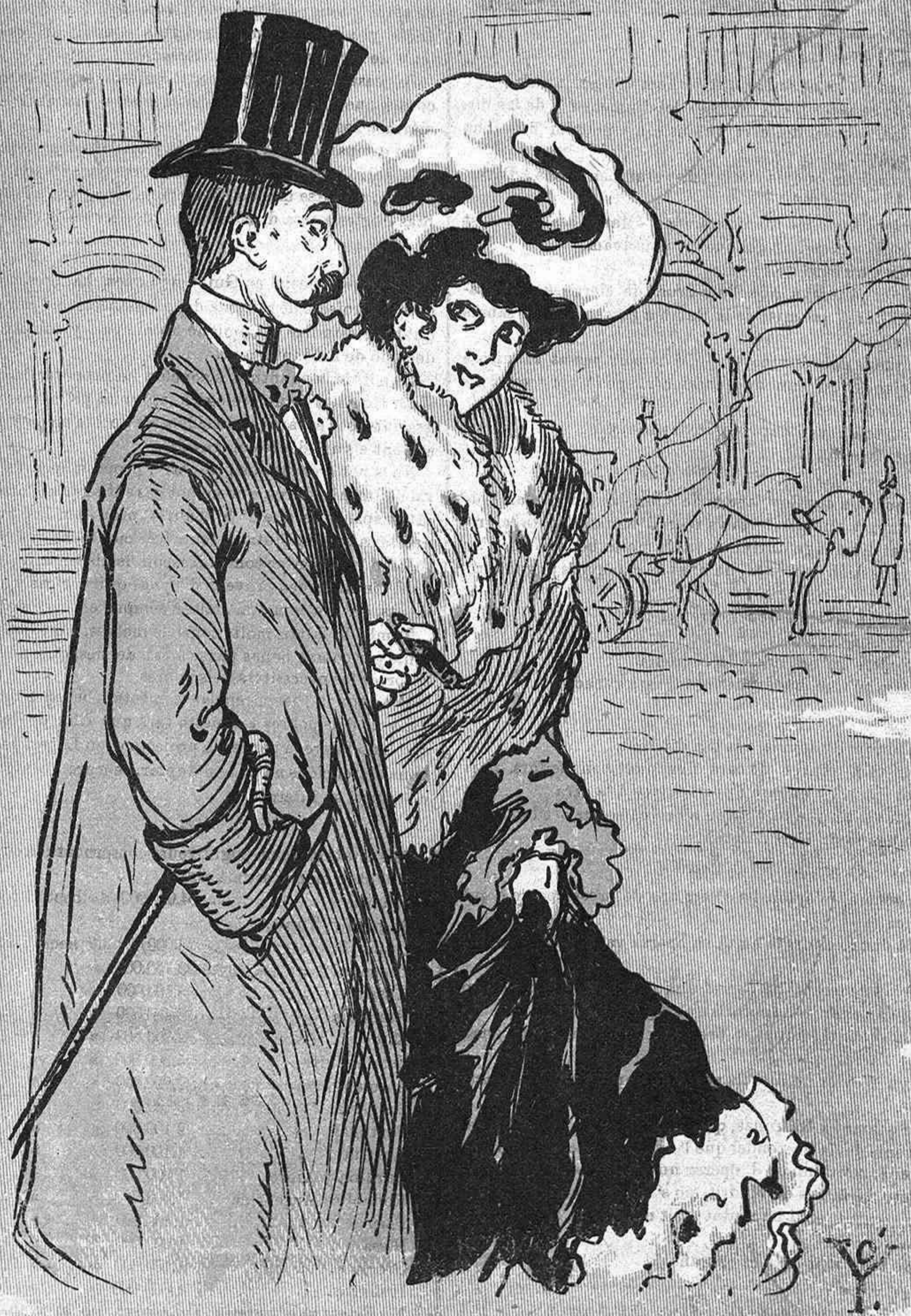
Una parella qu' acabant de dinar al Continental, s' en van á fer la siesta á la fonda de Sant Lluís.