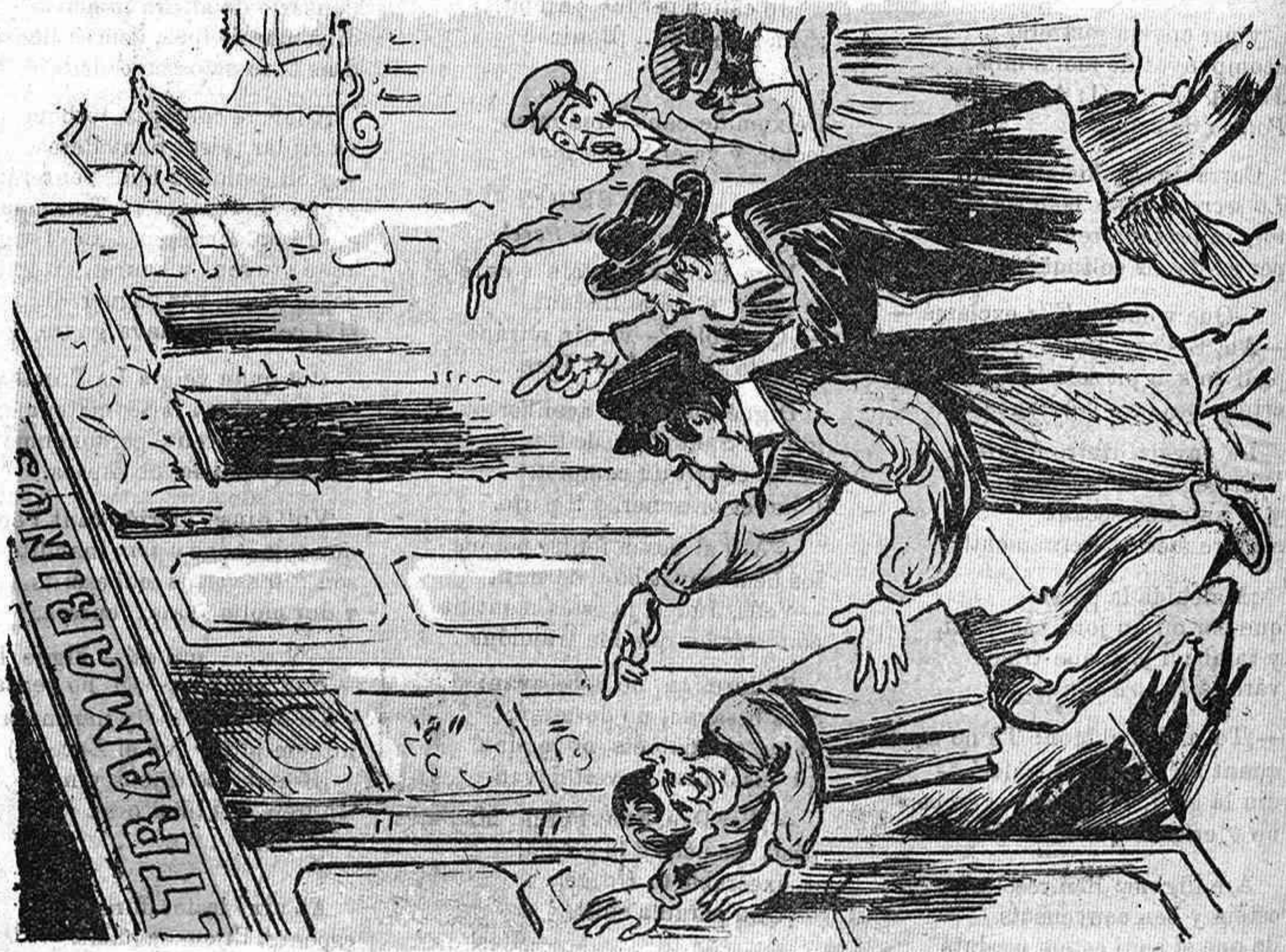
Perque 's compleixi el precepte del descans dominical, molts d' aquets passen las festas sense pogué descansar.