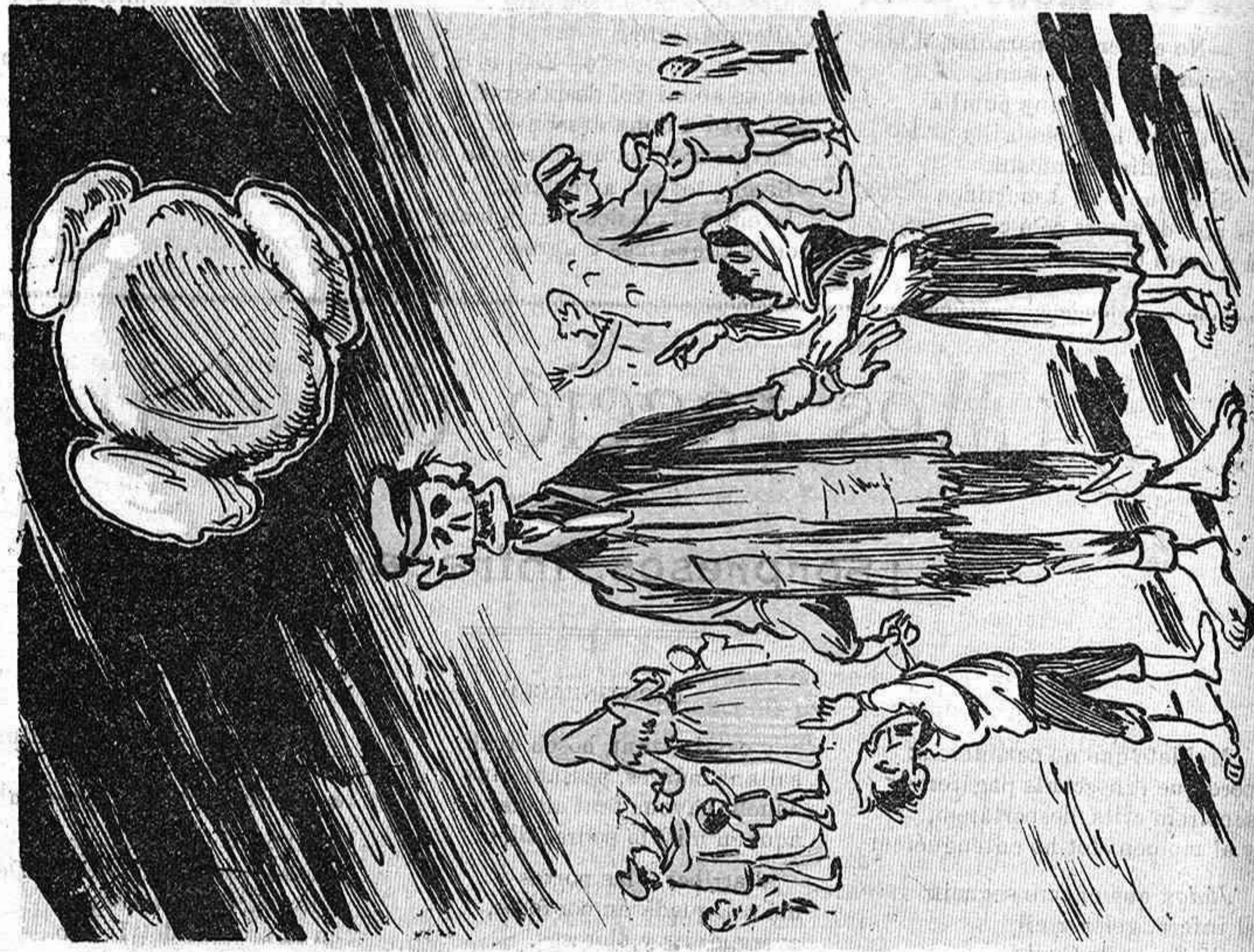
L' Estat pichs se desvetlla perque ho tingan tot a punt y en tant l' aliment deis pobres res li fa que vagi amunt.