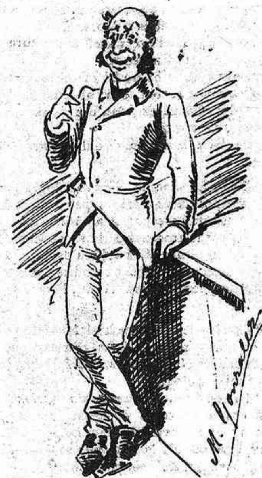
A las deu hi va aquest trasto. molt currido y filosof; y com que ja ha fet p' el gasto, ab aquest, tanca de cóp.