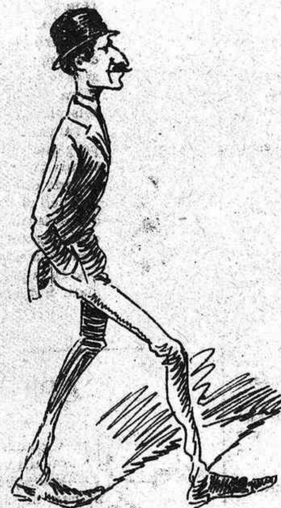
No hi deixa á las vuit d' anarhi: es fabricant de sombrillas, y está ja... que té un canari mes carn á las pantorrillas.