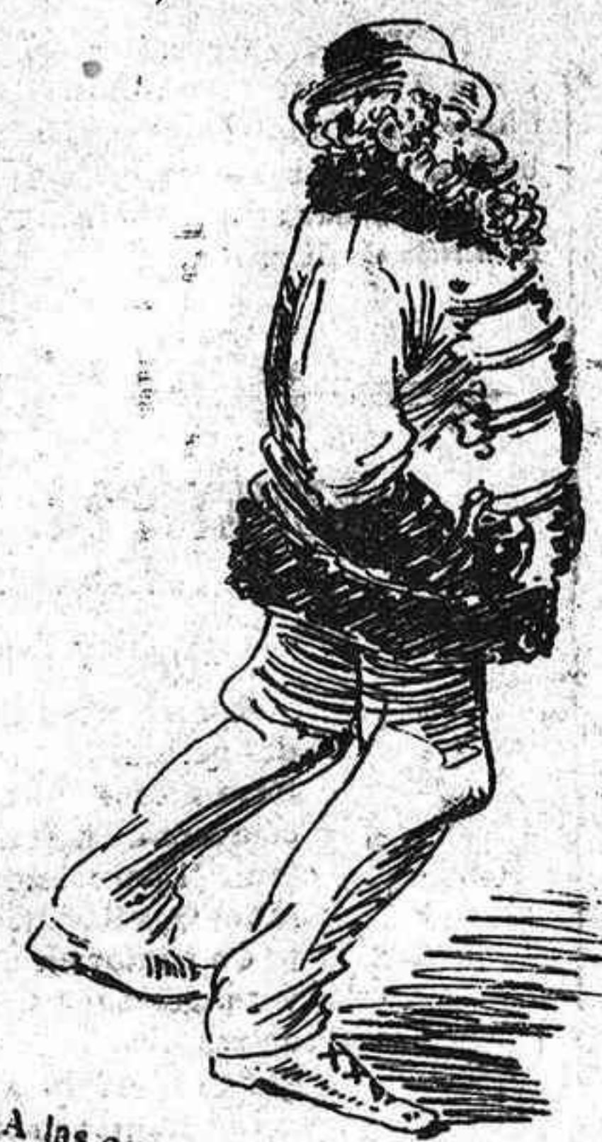
A las quatre hi va un pintor que li fa un quadro á la tinta; mes segons sento á dir jo, no se sab lo que li pinta.