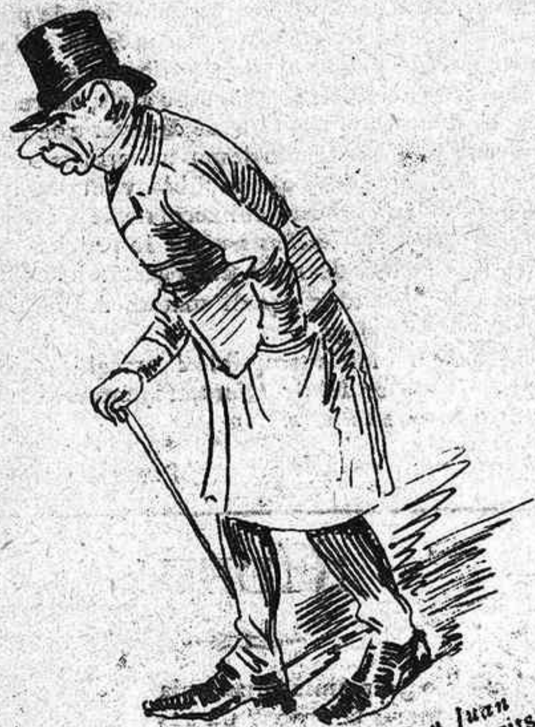
A la una hi va Don Juan qu' es dels vells mes aixerits, y encara que li ensenya 'l cant, lo vehinat no sent may crits.