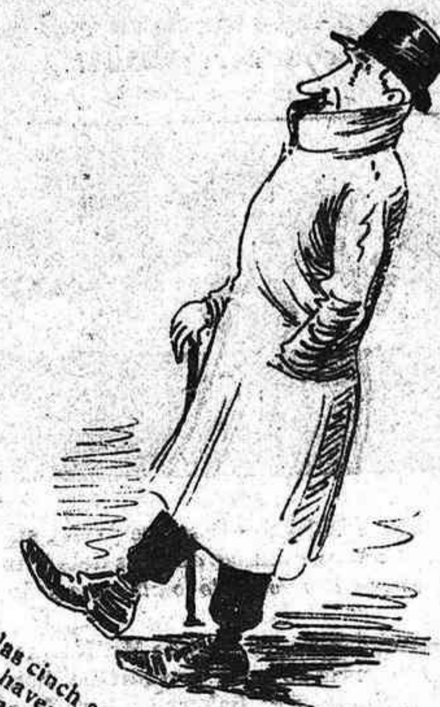
A las cinch aquest coll curt hi va, haventne molts noiat que quan de la casa 'n surt porta el nas mes refilat.