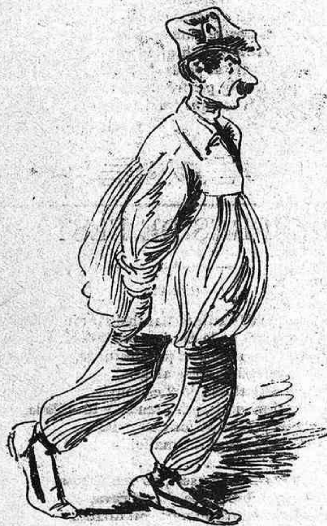
Aquest que hi fa llarga estada ja á las sis li trovaras pero á n' ella no li agrada perque hi entra per 'l detrás.