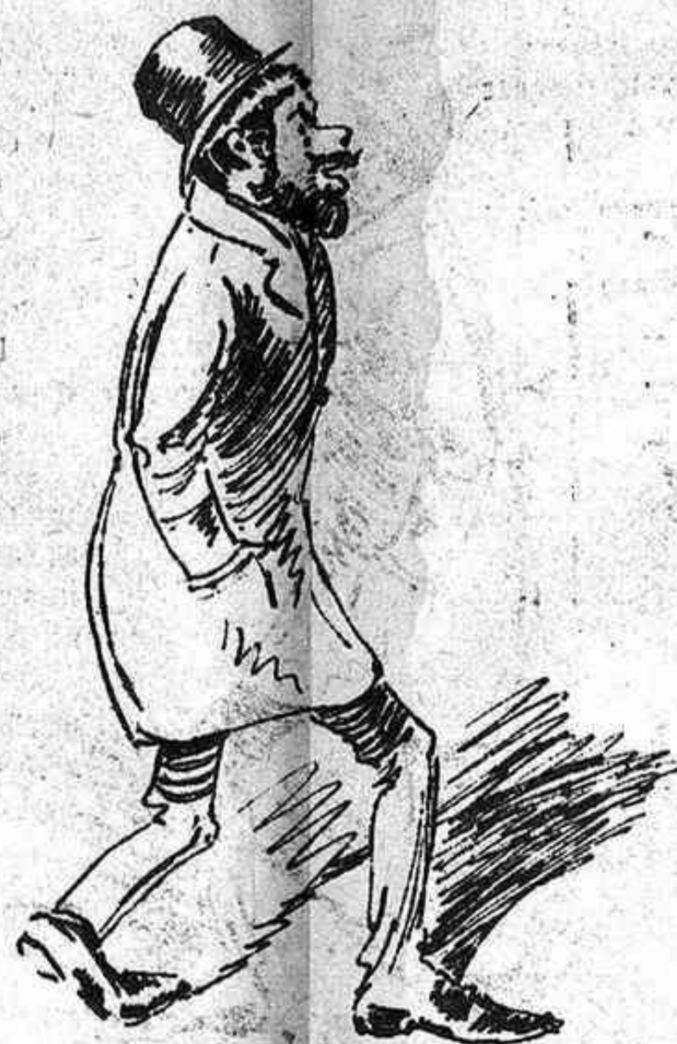
A las tres un empleat hi es puntual mes que ningú, y lo que roba al Estat ab gran constancia li dú.