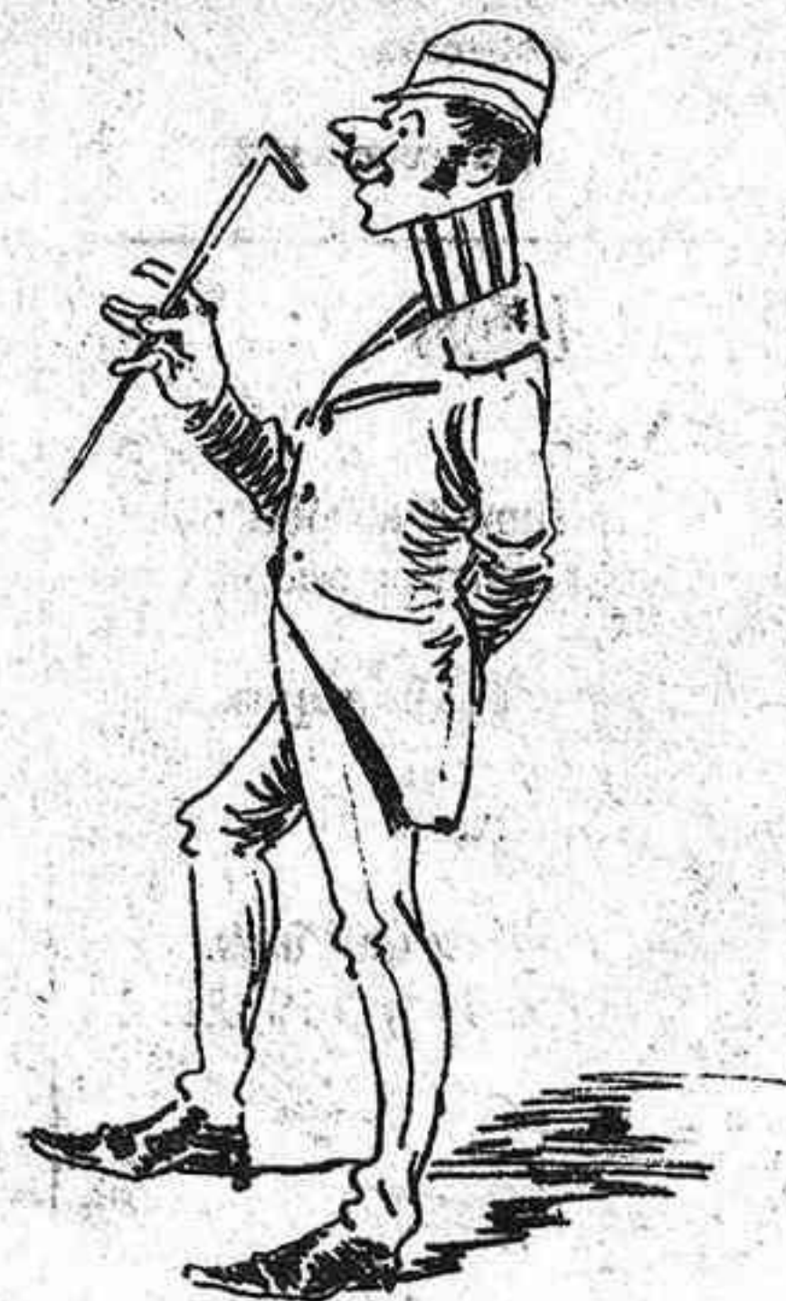
Aquest tipo de gomós á las set en punt hi es ab tractes de ferhi l' os fins que arreplegui diners.