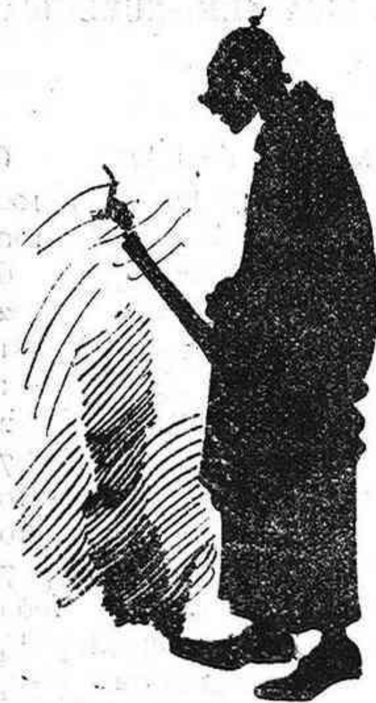
Ara si que ja he perdut l'esperansa d'arribar á Papa

—Ja sabeu que no podeu menjar carn! —Massa... No 'n fa poch de temps que no 'n puch menjar.