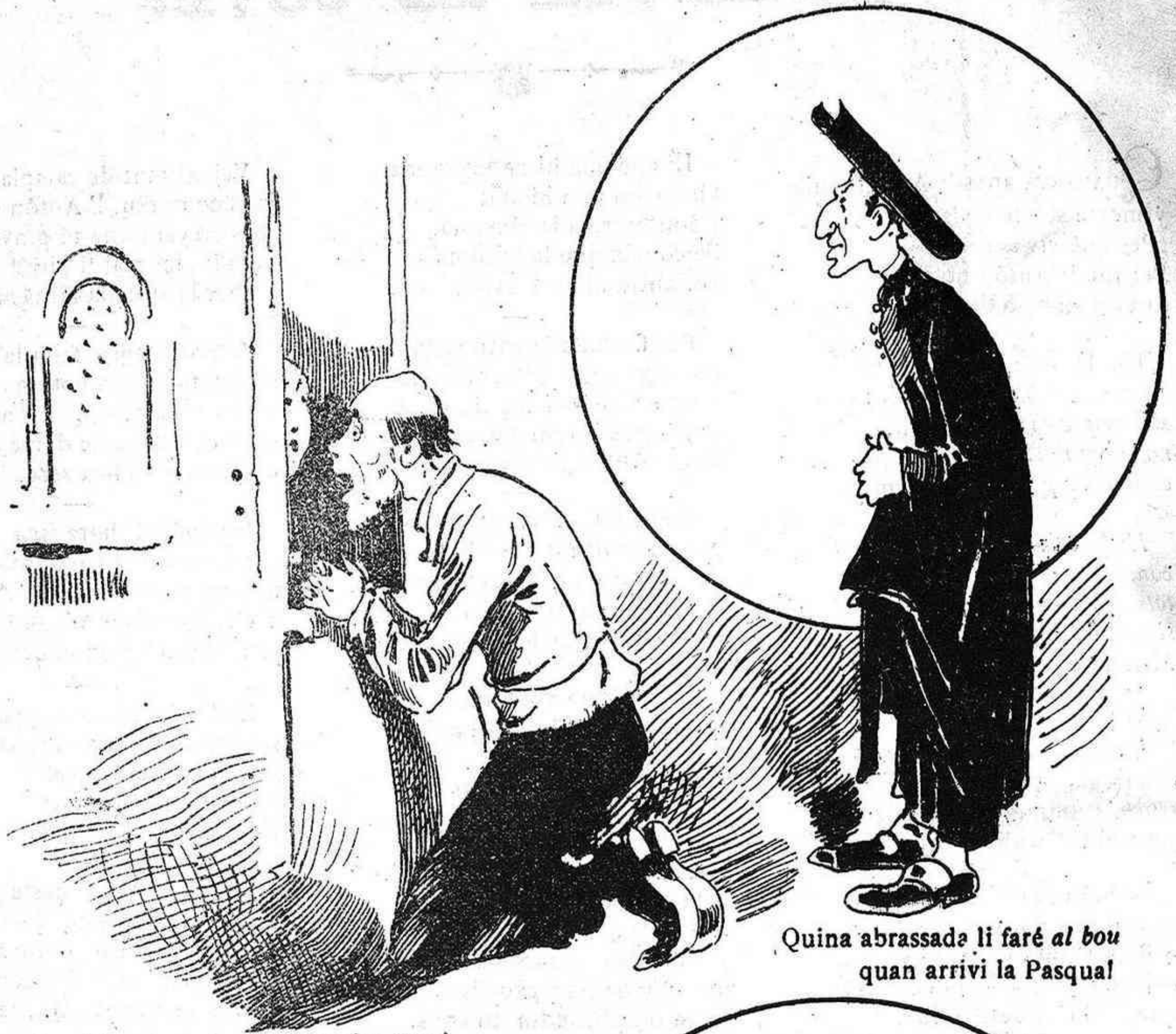
Quina abbrassada li faré al bou quan arribi la Pasqua!

—Ja sabeu que no podeu menjar carn! —Massa... No 'n fa poch de temps que no 'n puch menjar.