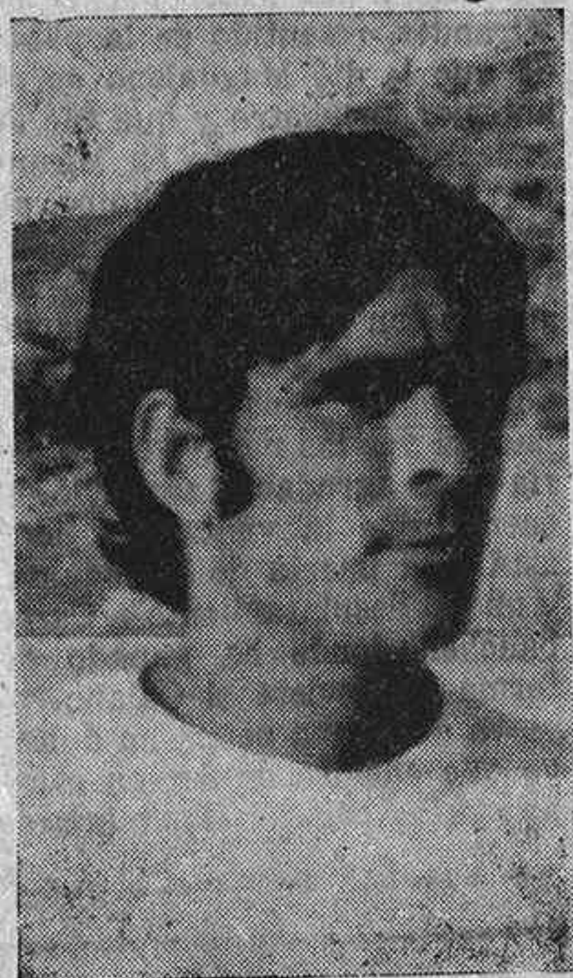
BUESA. Siguiendo en su línea de regularidad, Buesa cuajó un buen encuentro en Miranda, frente a los titulares del terreno

meta local. Por el contrario, el Mirandés supo aprovechar mejor sus oportunidades y encauzar rápidamente el encuentro con su temprano gol, que dió