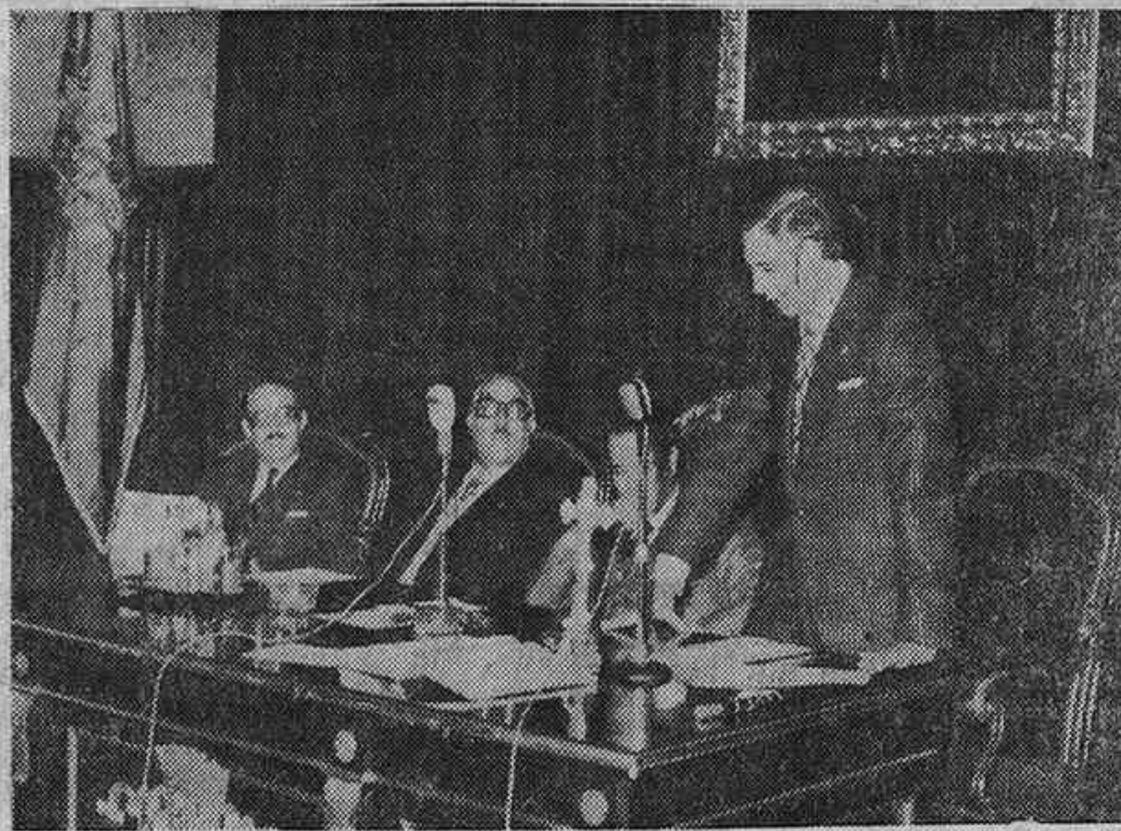
El nuevo presidente, durante su intervención

Compartió con él la presidencia el gobernador civil, señor Zaragoza Orts, y asistieron las demás autoridades provinciales y locales, las Corporaciones Provincial y Municipal de Guadalajara, miembros del Consejo Provincial del Movimiento, de la C.O.S.A., Comunidad de Regantes del Canal del Henares, y representaciones de muchos pueblos de la provincia, en las personas de sus alcaldes y secretarios, así como un nutrido grupo de familiares y amigos del nuevo presidente, hasta el extremo de hacer pequeña la amplia sala.