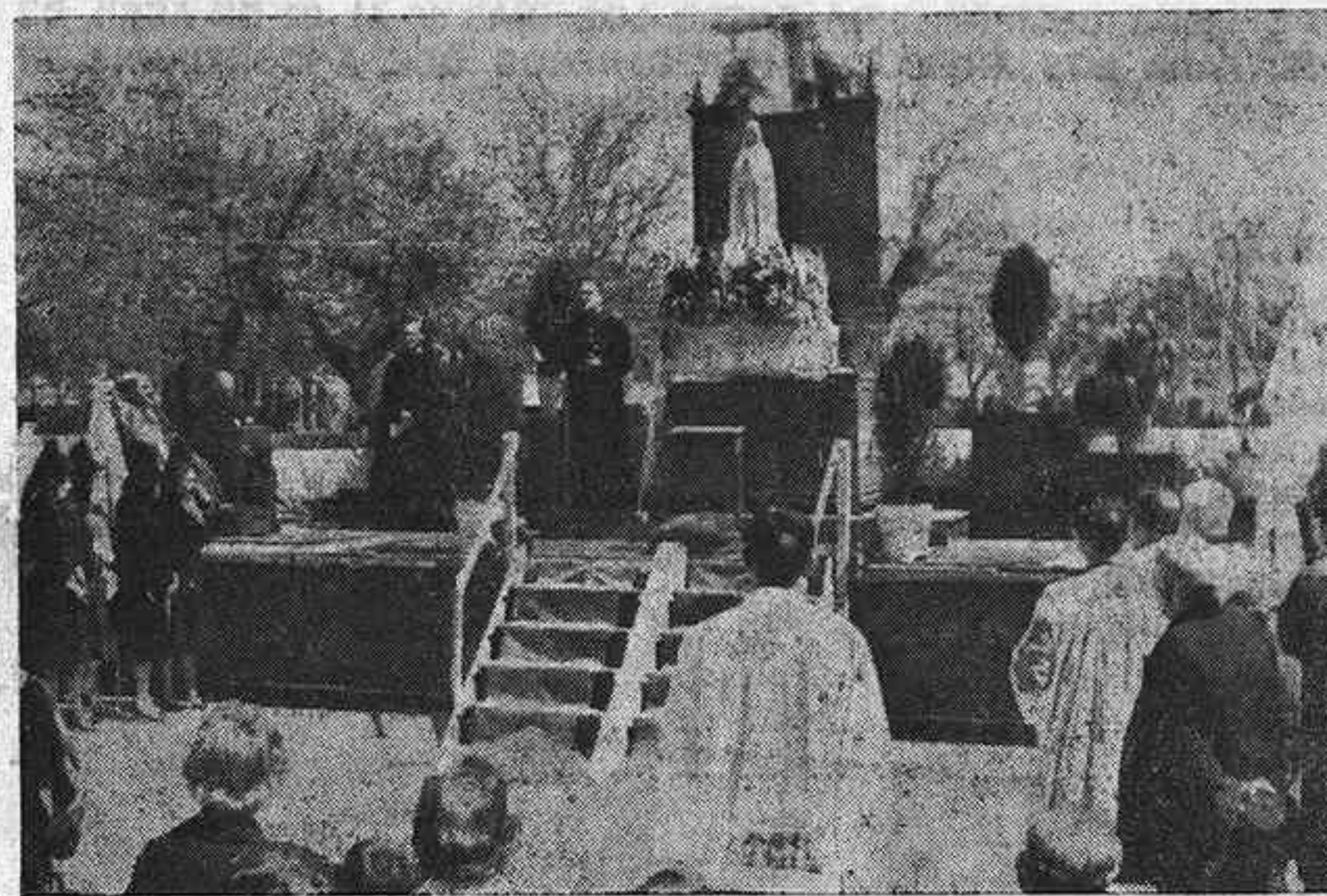
En nuestra foto de archivo, el acto de despedida de la imagen en su última visita a Guadalajara, celebrado en el paseo de la Concordia. Era el día 6 de febrero de 1960.

grama de actos y otros extremos de este importante acontecimiento mariano, el pasado viernes tuvo lugar una reunión