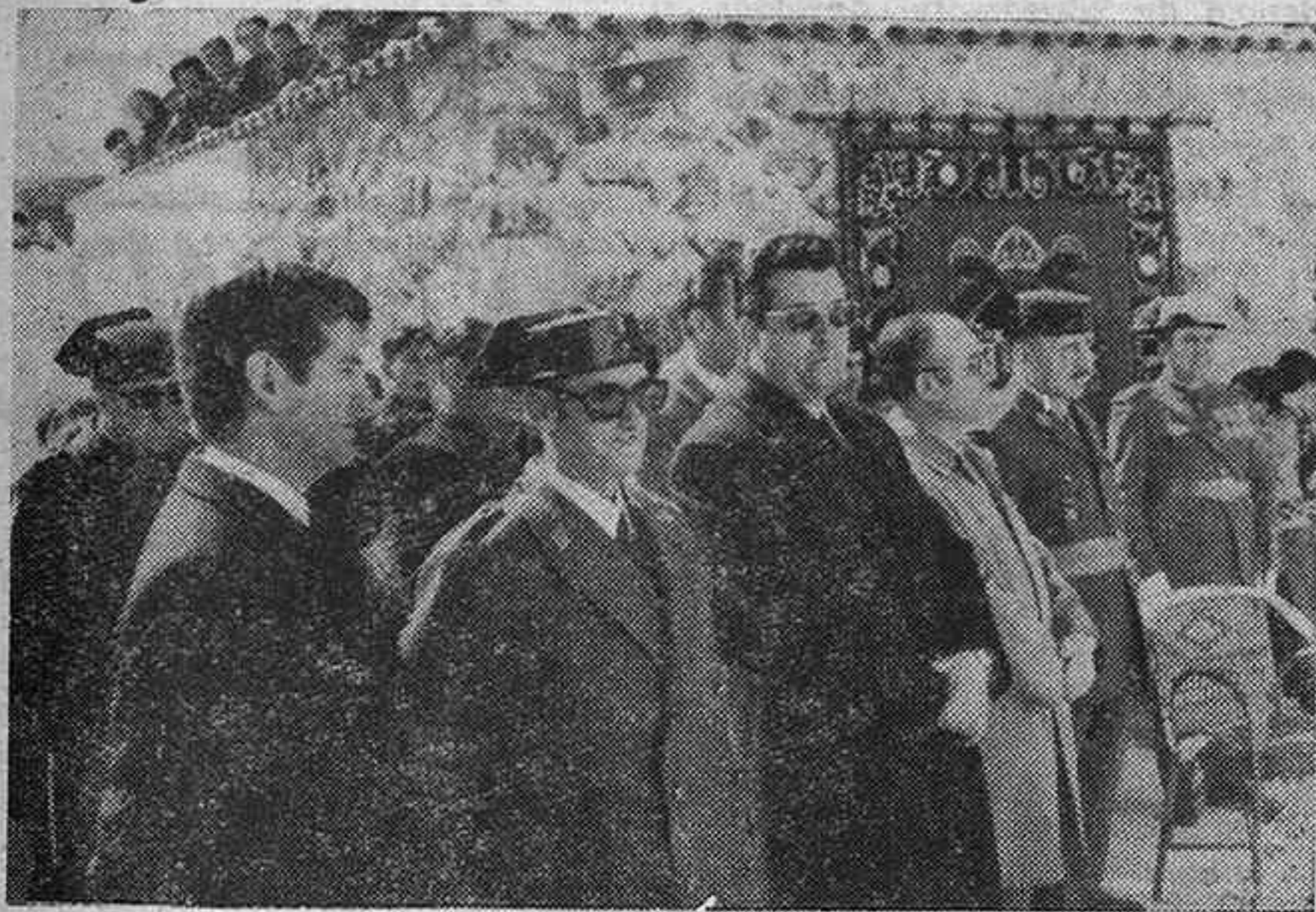
Las primeras autoridades durante la ceremonia de entrega de bandera.