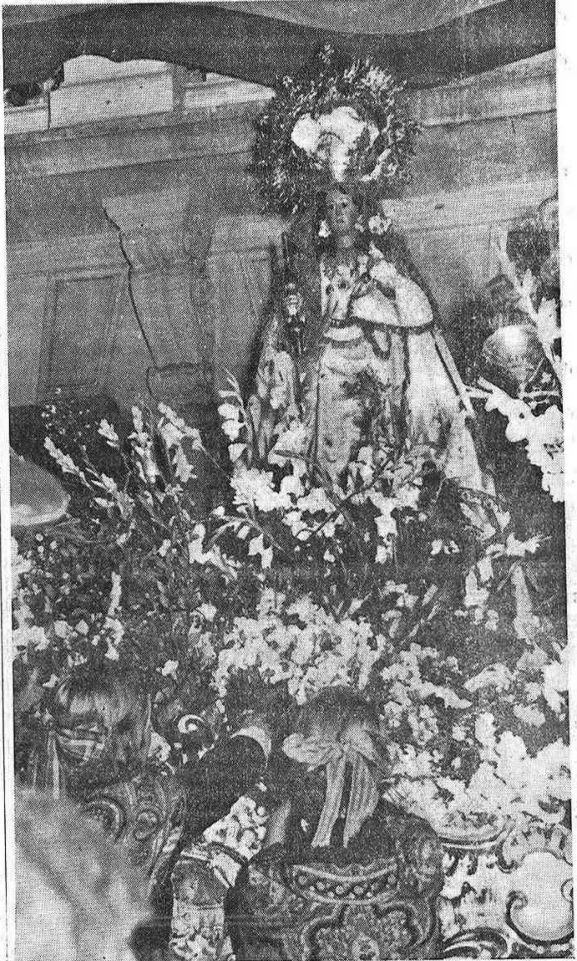
La ofrenda de flores ante el Ayuntamiento.