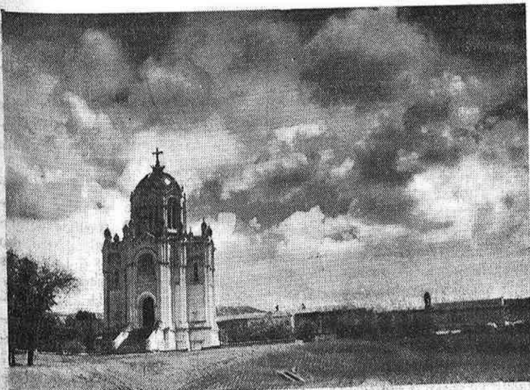
Fotografía obra del señor Lirón, que ha obtenido el primer premio en la Exposición Suc. de Antero Concha

Por espacio de ocho días ininterumpidos ha permanecido abierta al público, en los locales del Hogar del Productor, la exposición fotográfica patrocinada por la Imprenta del Su-