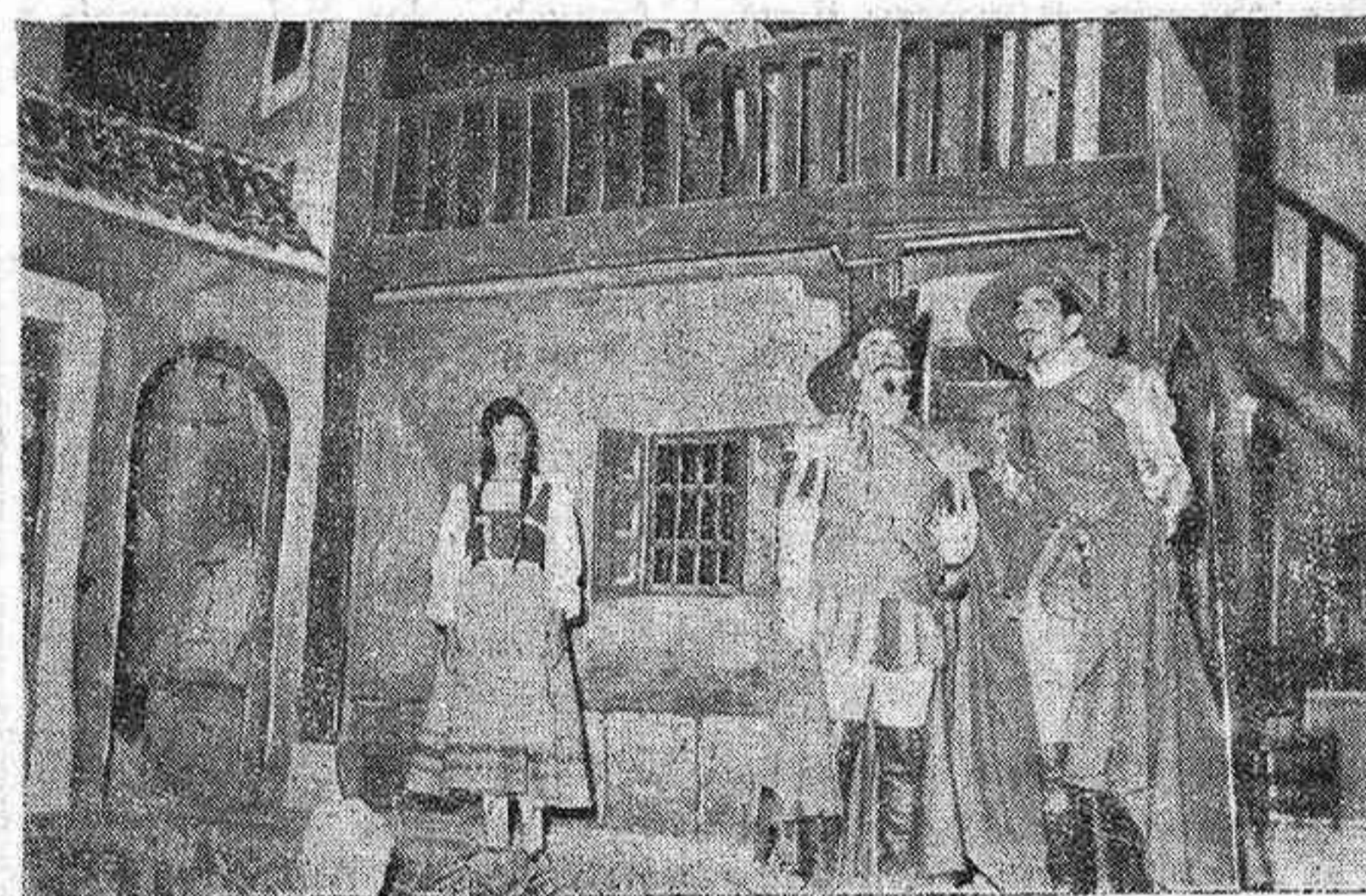
"Alcalde de Zalamea"