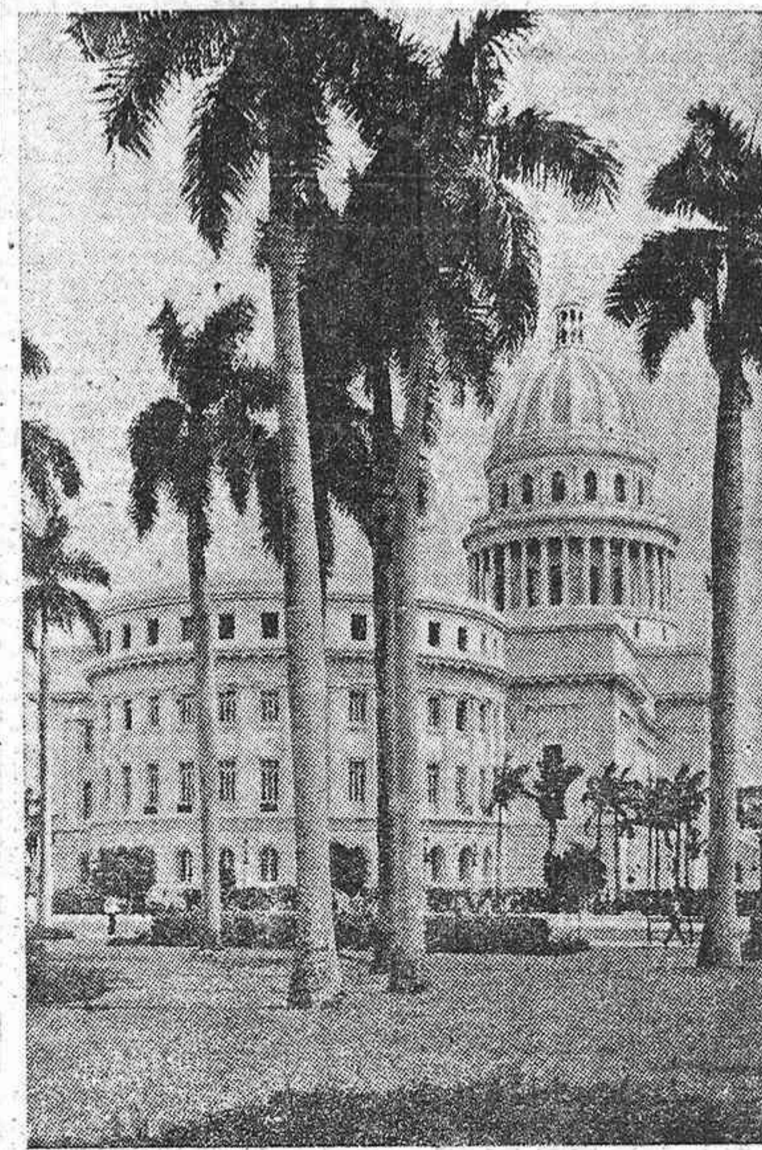
En la Conferencia de Bogotá se ha dicho que Cuba es uno de los países que sufren a mayor presión las actividades comunistas. He aquí el edificio del Capitolio en La Habana

WASHINGTON, 6.—(SERVICIO ESPECIAL DE CRONICAS EFE-UNITED PRESS.—PROHIBIDA LA REPRODUCCION.)