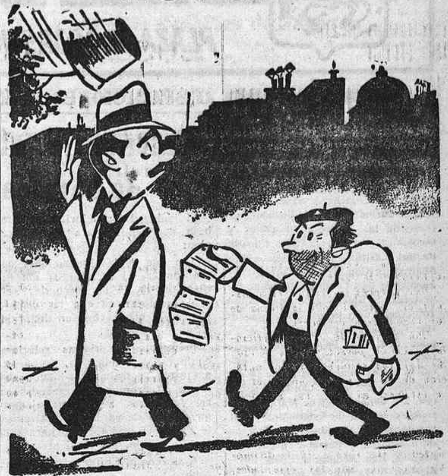
—Gracias; a mí nunca me que nada.