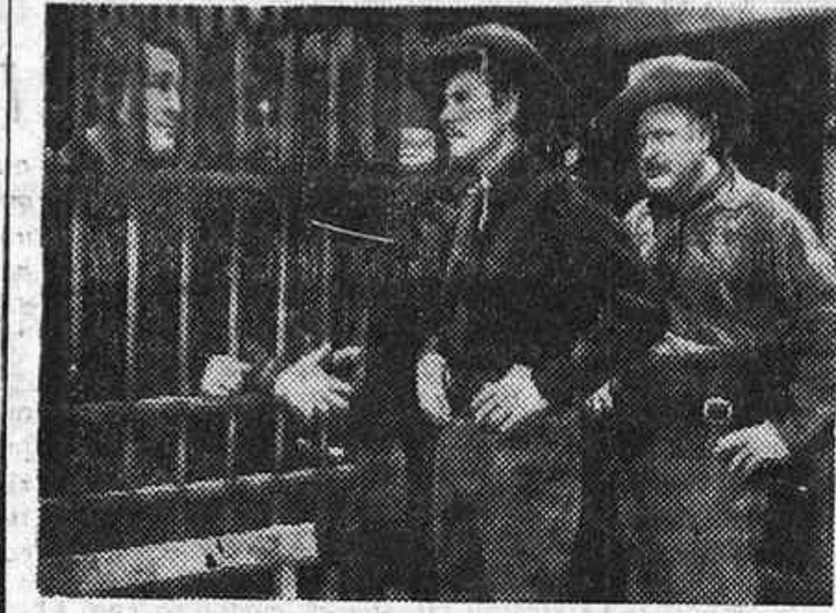
"Dodgy, ciudad sin ley", la magnífica película que ha presentado Balet y Blay, entra en su cuarta semana de proyección en el cine Colisevm. Un éxito reconocido por todos. La foto nos muestra una interesante escena de esta película