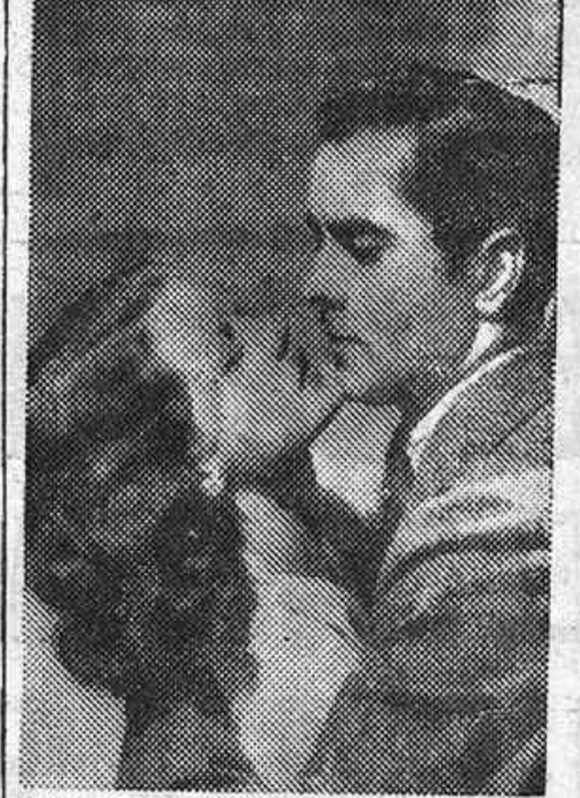
"Madame Sans Gêne" nos revela la historia de una heroína popular de Francia, Catalina Hubscher. He aquí una escena de esta película, que presentada por Filmófono veremos muy pronto en Madrid

seguros en sus papeles para interpretar "Dodgy, ciudad sin ley". Errol Flynn, Olivia de Havilland y Ann Sheridan. Actores para los que el color parece haber sido inventado, ya que sus características son favorabilísimas. Balet y Blay se honra en presentar esta grandiosa producción y sensacional película, que ha constituido un sensacional acontecimiento de público y crítica en la inauguración de la nueva temporada del elegante Colisevm, donde se proyecta en cuarta semana a llenos diarios.