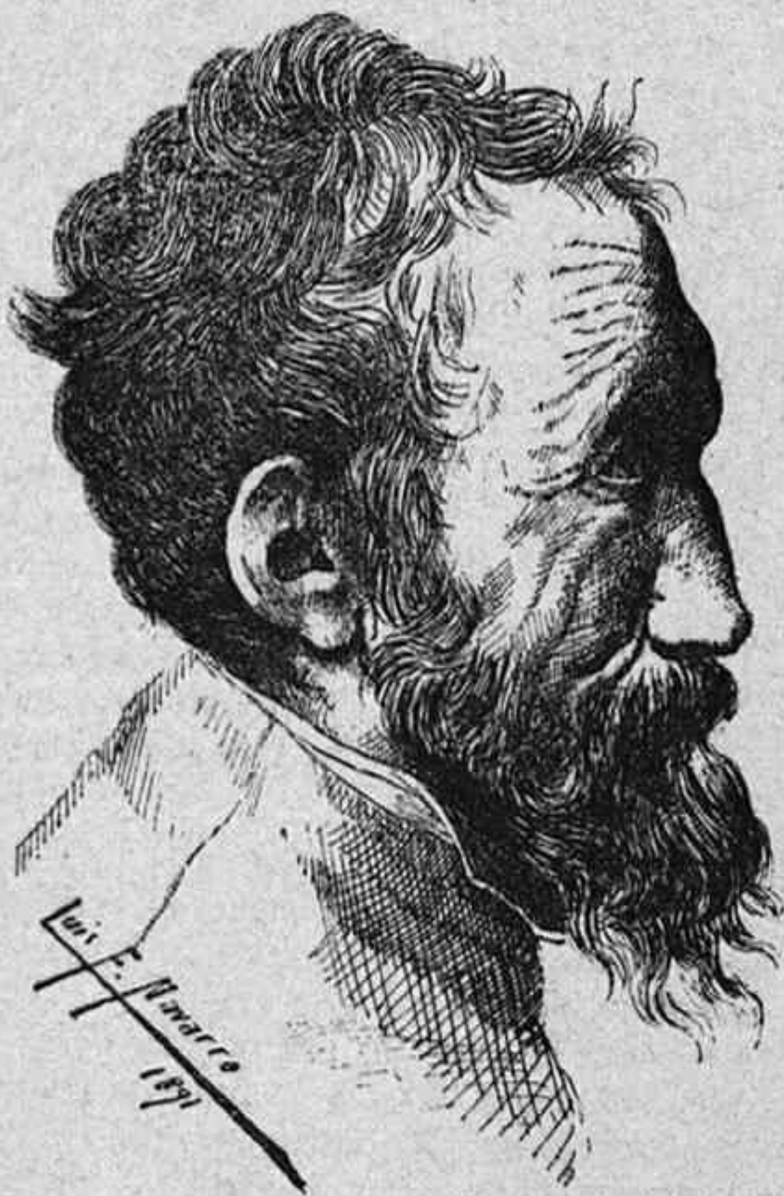
MIGUEL ANGEL BUONAROTTI

Colocando dos cartas arriba y otras dos abajo , cuyas últimas, sin salirnos del garito , tiene por nombre el gallo , poner ó jugar á la cruz , representa dejar el dinero en la baraja que descansa, y si ha salido, por ejemplo, una de las de abajo y situada á la derecha del banquero, hay que colocar