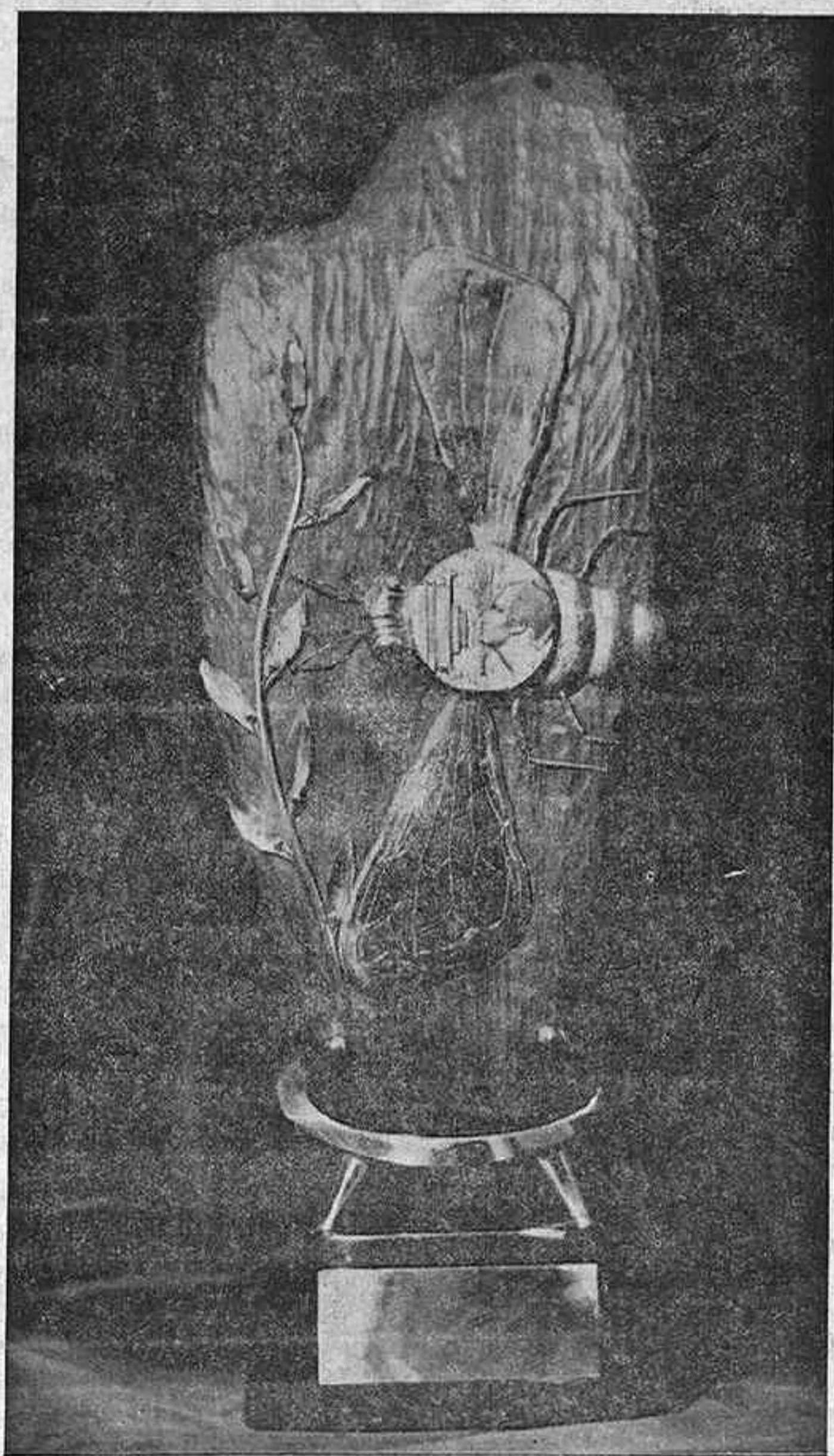
Trofeo «Abeja de Plata», que será otorgado al Premio de Honor en este Certamen

Se admiten fotografías en blanco y negro, y color, hasta el 20 de septiembre