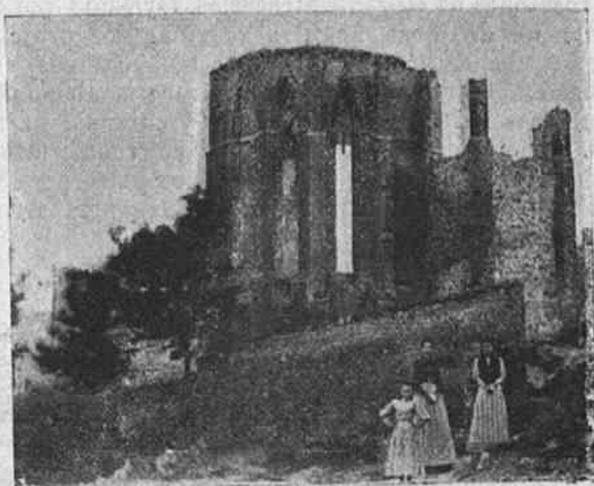
Convento de San Francisco (Atienza).