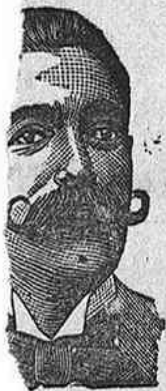
COSTANZI 35 BARCELONA