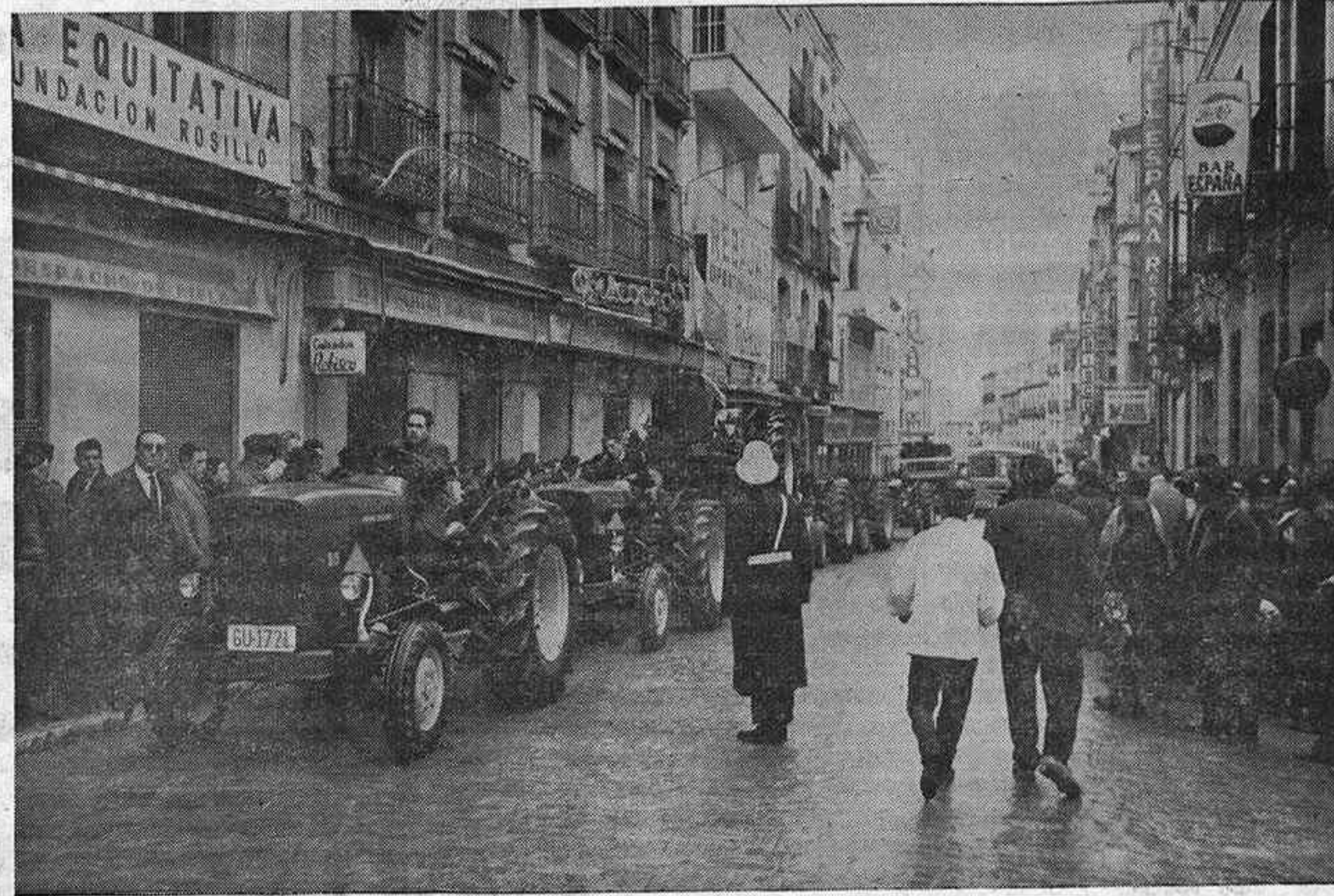
La caravana de nuevos tractores en un momento de su paso por nuestra calle Mayor.

Sobre la tapa de la caja de cambios, aparece un esquema en relieve