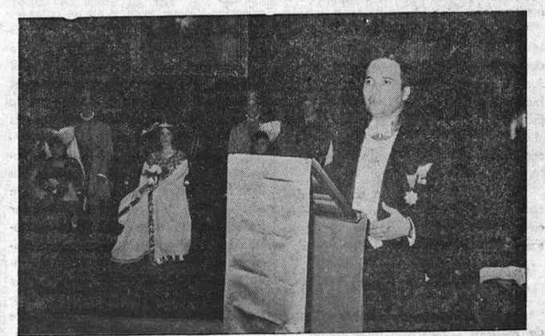
El mantenedor en el curso de su intervención.

En la noche del pasado domingo, con asistencia de selecto y numeroso público, tuvo lugar, en el salón de actos de la Diputación Provincial, la jornada final de las IV Justas Poéticas de Primavera, organizadas por la Delegación Provincial de Juventudes.