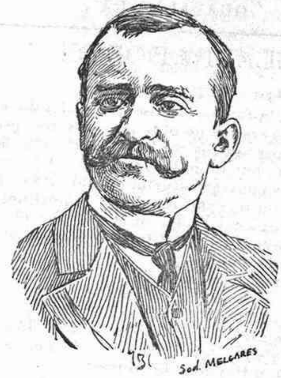
Gracia y Justicia: Romanones