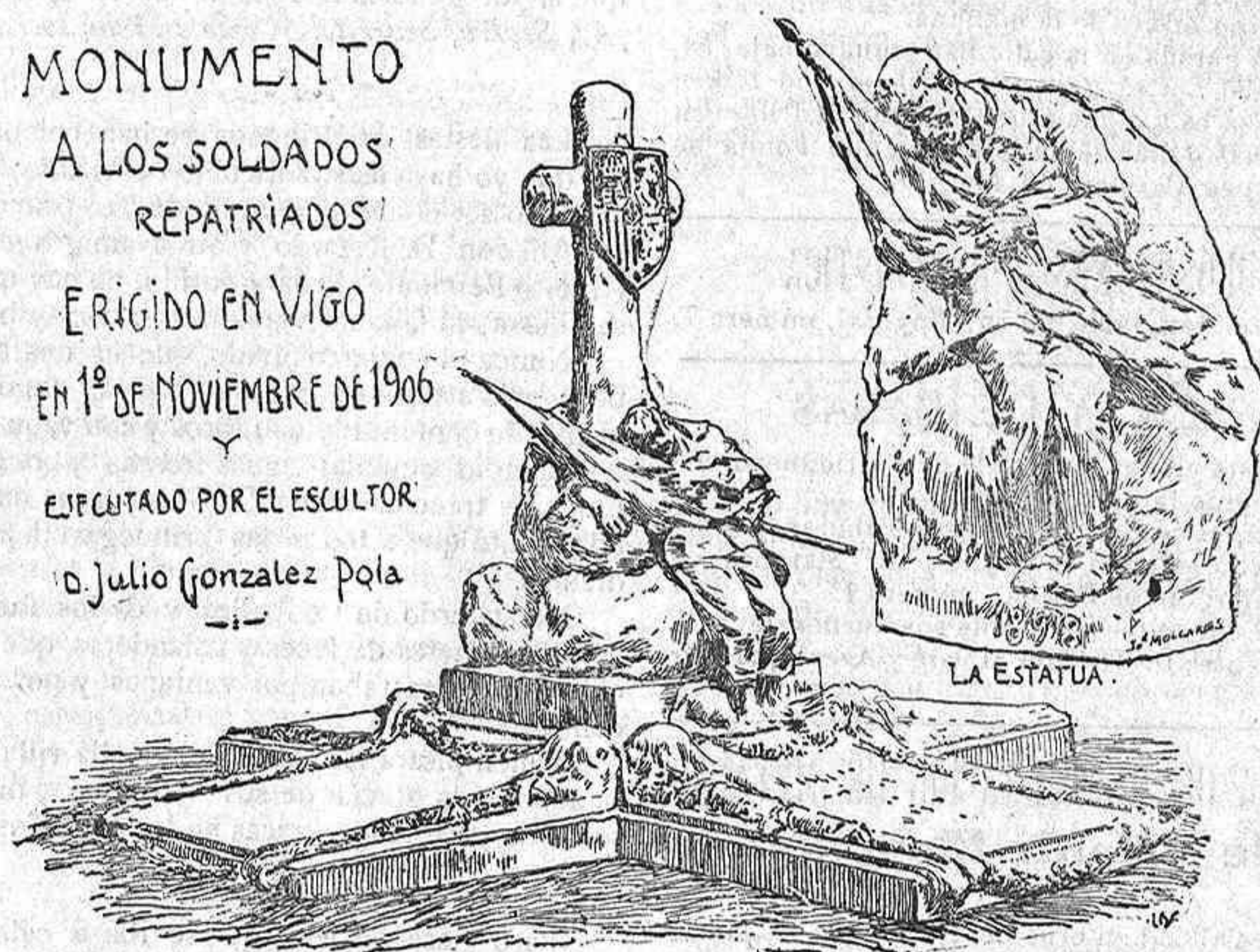
DIBUJO DEL NATURAL, POR MORENO

Y EJECUTADO POR EL ESCULTOR D. Julio Gonzalez Pola