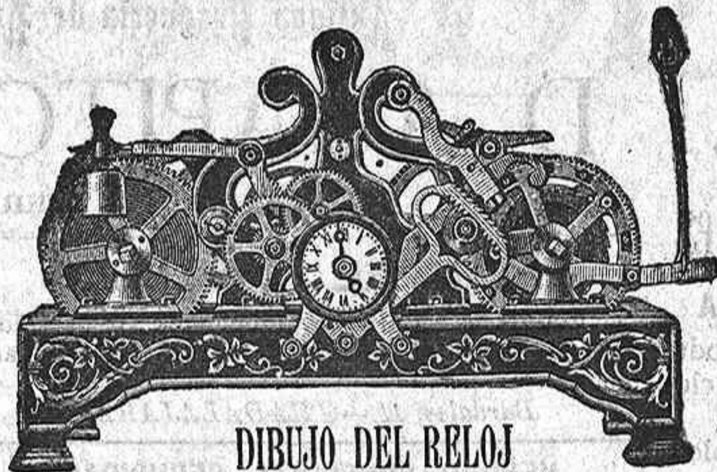
DIBUJO DEL RELOJ

NOTA. Único depósito en Guadalajara del reloj Moeris, que está construido especialmente para ingenieros y electricistas; antimagnético verdad, forma extraplana.