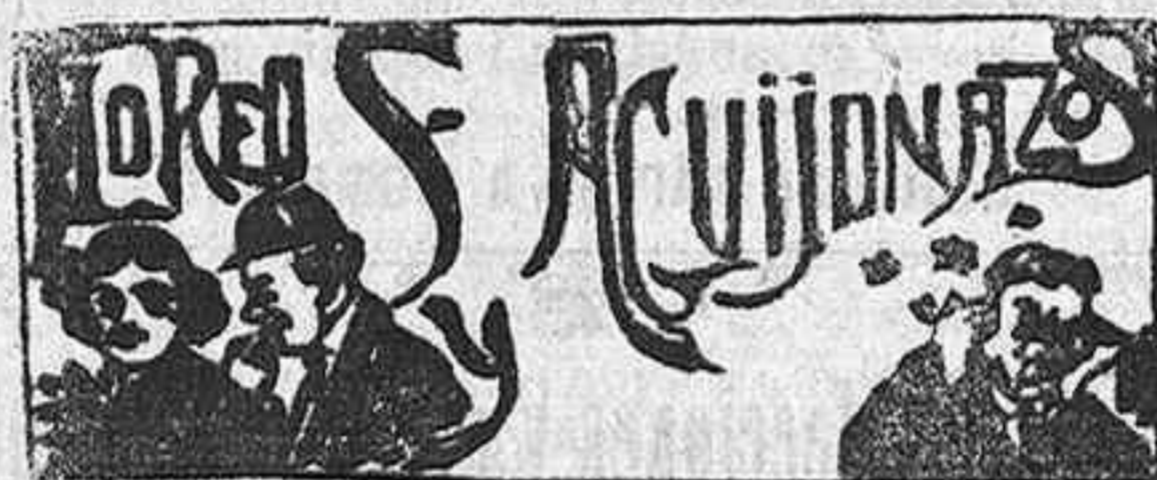
Al bibliófilo desconocido

En el periodismo, para ser Doctor , hay que dar la cara, mirar frente a frente, pues no es periodista, sino zapador , quien hiere al amigo clandestinamente.