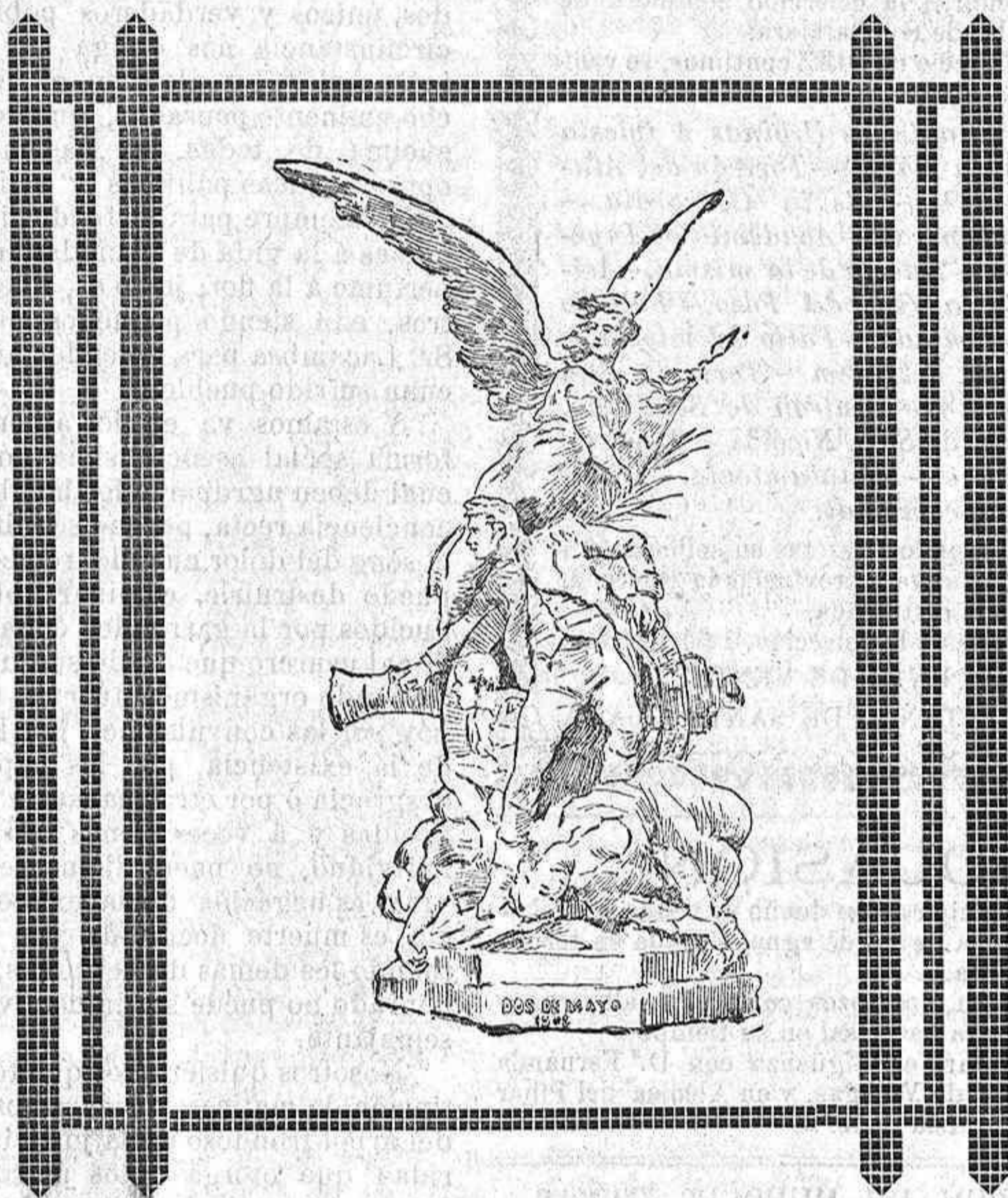
MONUMENTO A LOS HÉROES DEL DOS DE MAYO

Imprenta y Librería de Antero Concha Plaza de Correo, 2.—Guadalajara