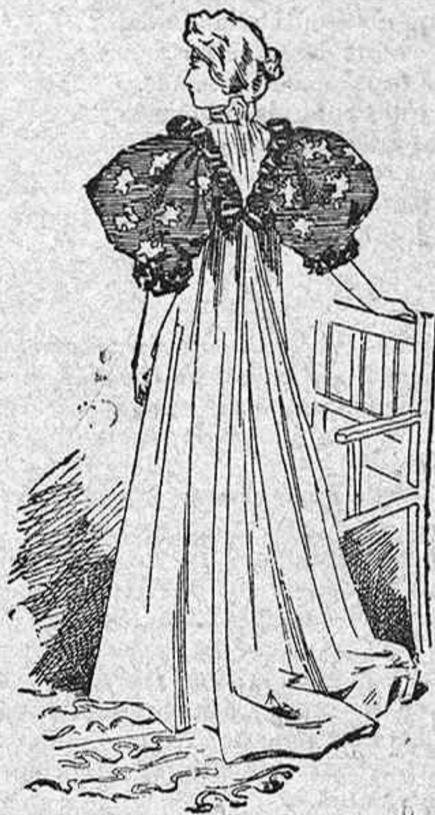
Bata de visita.

Modelos exclusivos para nuestras lectoras, de los Grandes Almacenes de EL SIGLO, Barcelona (1.)