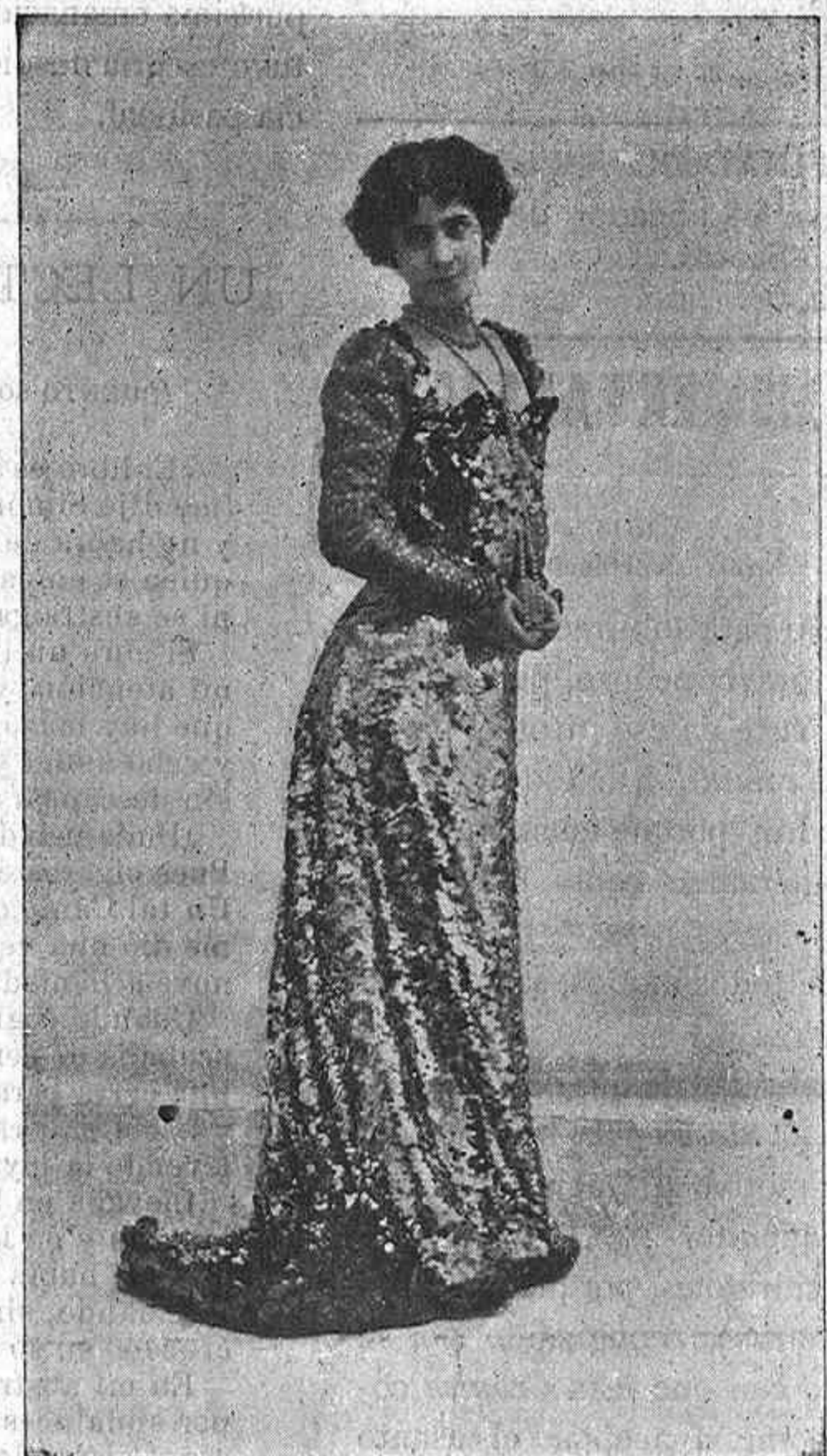
LA BELLA GUERRERO