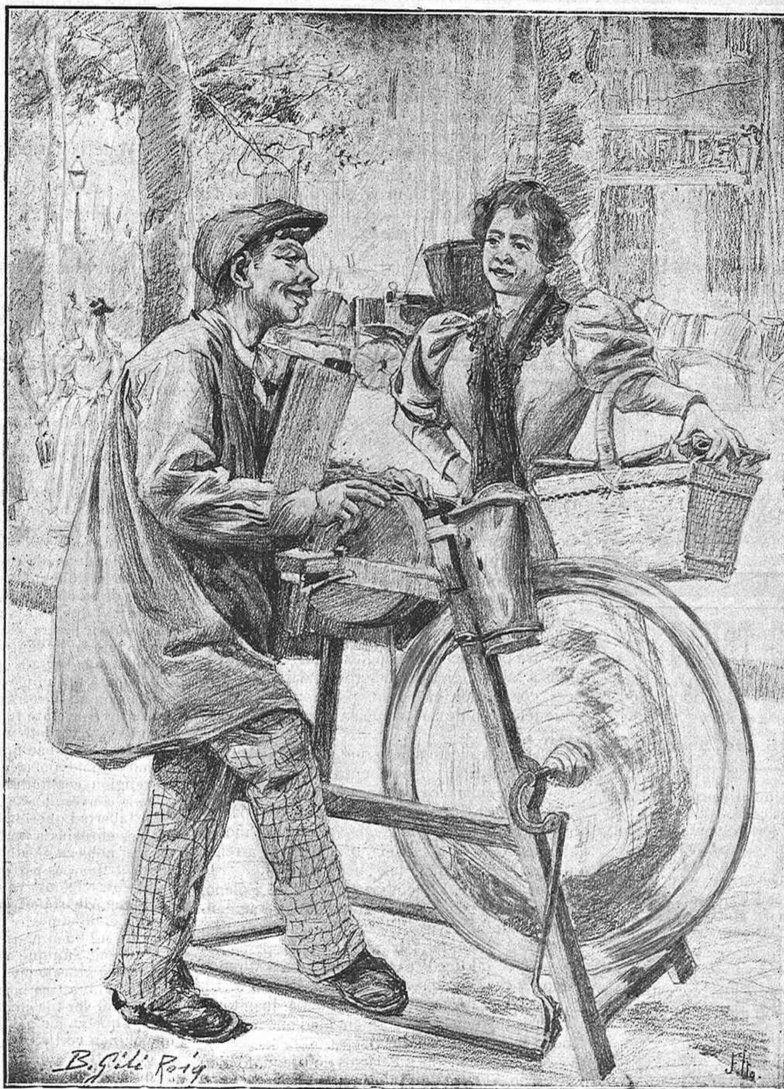
DE PALIQUE, por Roig.