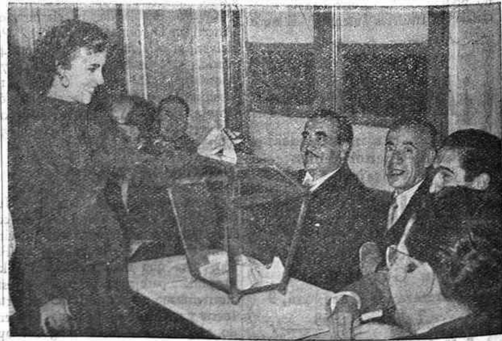
Escenas como la que recoge la "foto", se repitieron en el día de las elecciones. Una votante del Sindicato Textil deposita su papeleta en la urna. (Reportaje fotográfico de López-Palacios).