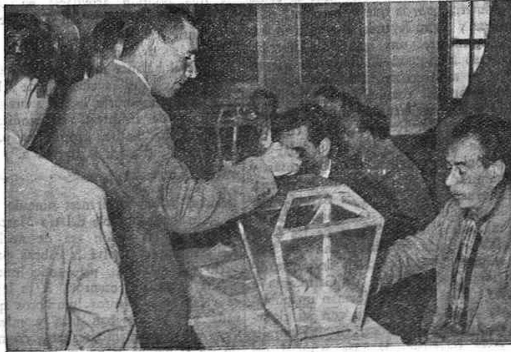
Los obreros del Sindicato de la Construcción acuden a elegir sus representantes en las Juntas Sociales del Sindicato.