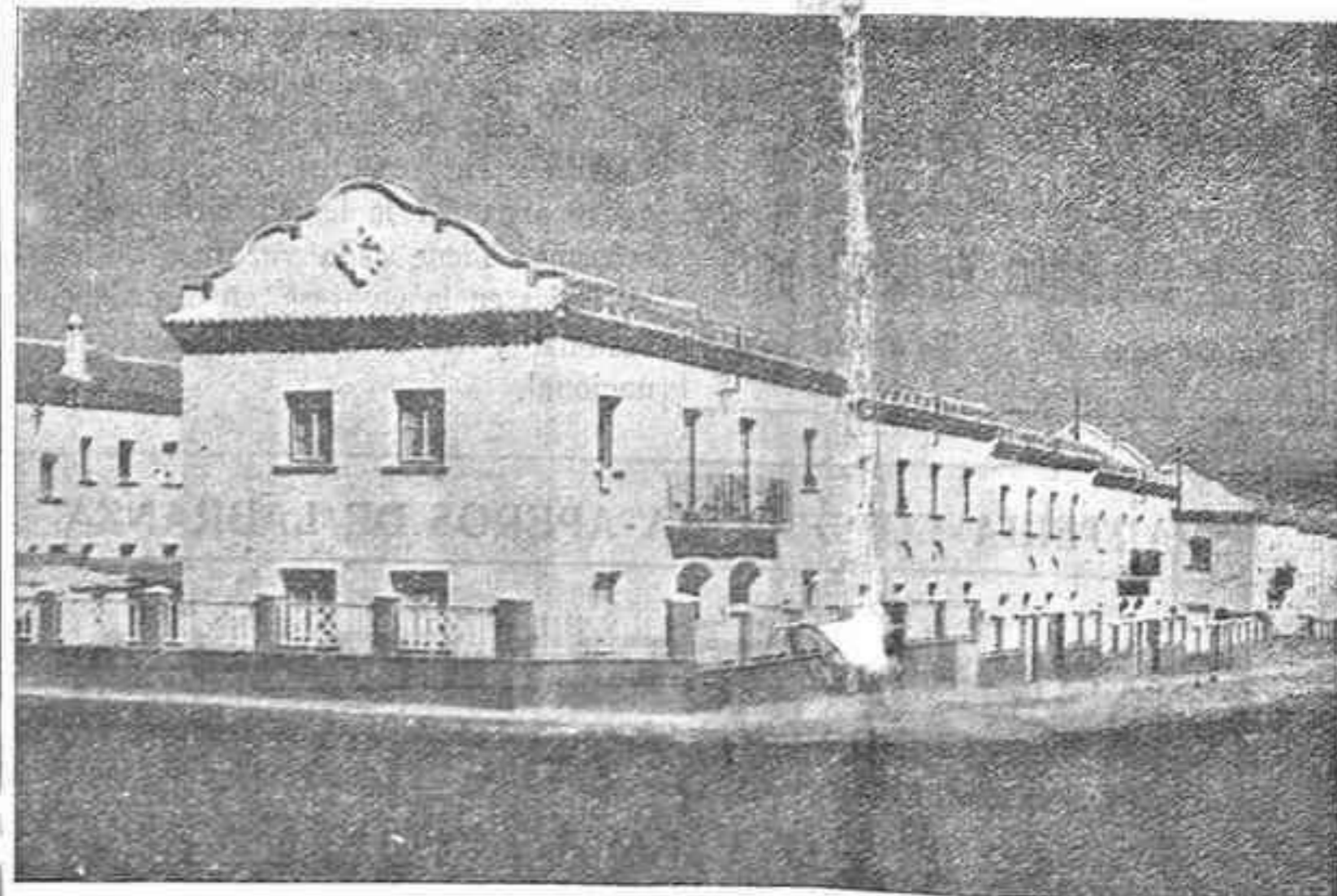
Una bella perspectiva del Grupo Sindical "Las Cruces", construido en nuestra capital por la Obra Sindical del Hogar.

La cuadrilla vencedora, tomará parte en el Concurso Nacional, que se celebrará en Madrid.