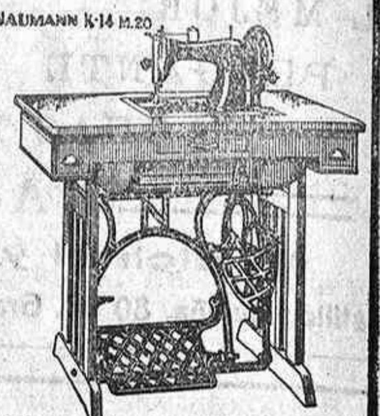
NAUMANN K-14 M.20 Bobina central, Armadura de madera, Mueble lundible, dos gavetas y cajón. Cierre persiana.

El que compra NAUMANN, sabe lo que hace y además es un gran administrador de sus intereses. CONSULTEN PRECIOS. MUCHAS FACILIDADES EN LOS PAGOS