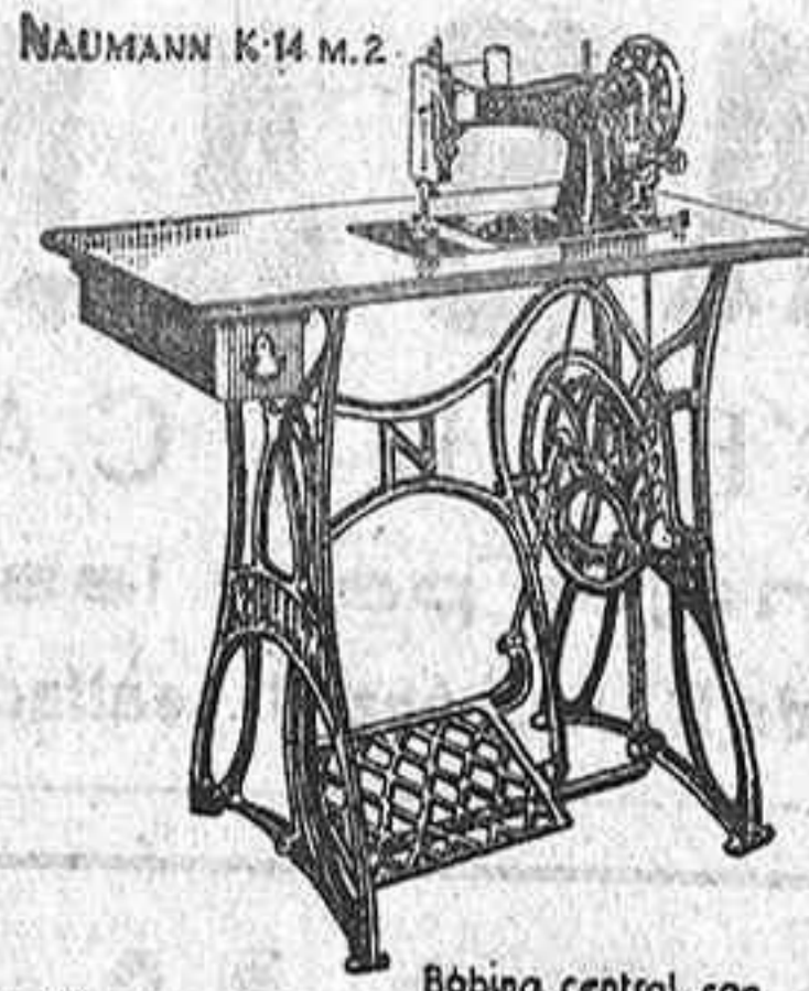
NAUMANN K-14 M.2 Bobina central, con bobina suelta y volante grande.