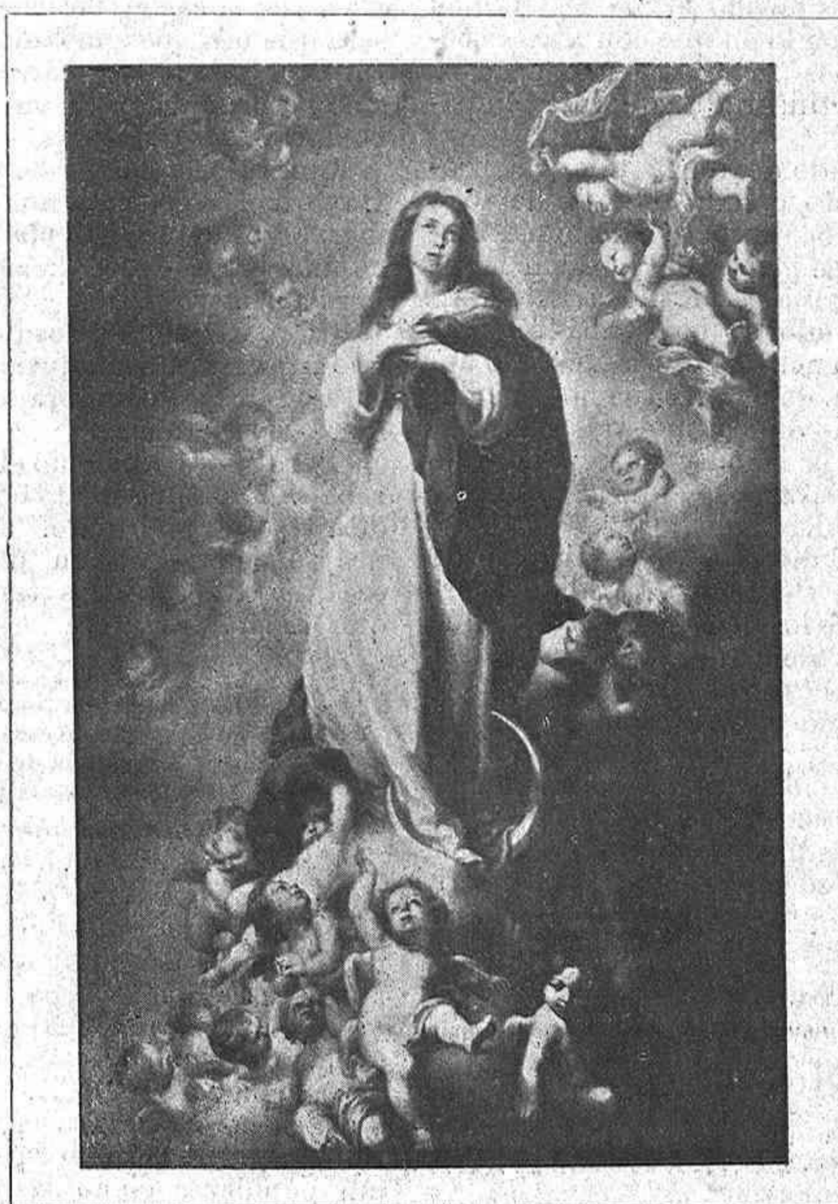
PURÍSIMA CONCEPCIÓN DE MARÍA INMACULADA