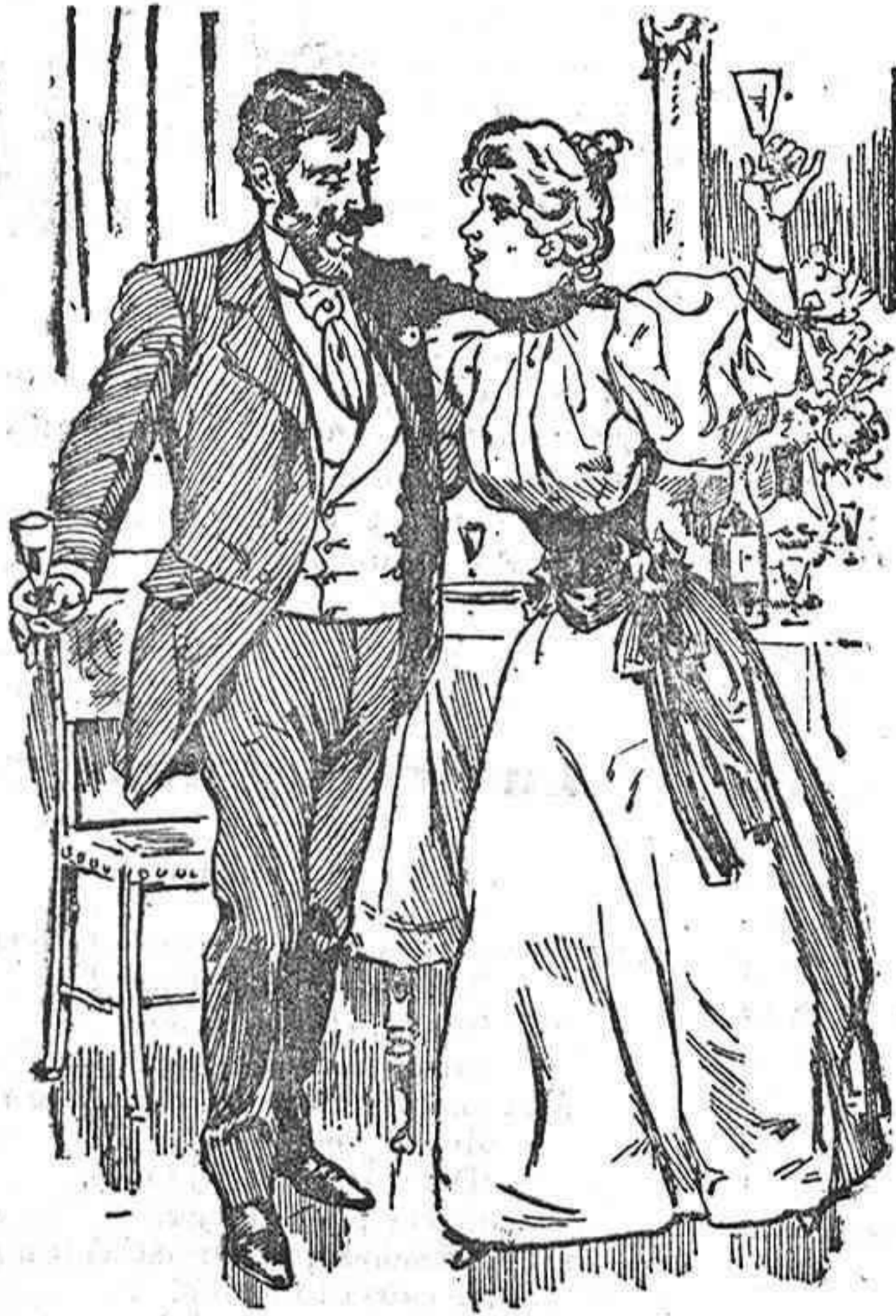
Los primeros días.