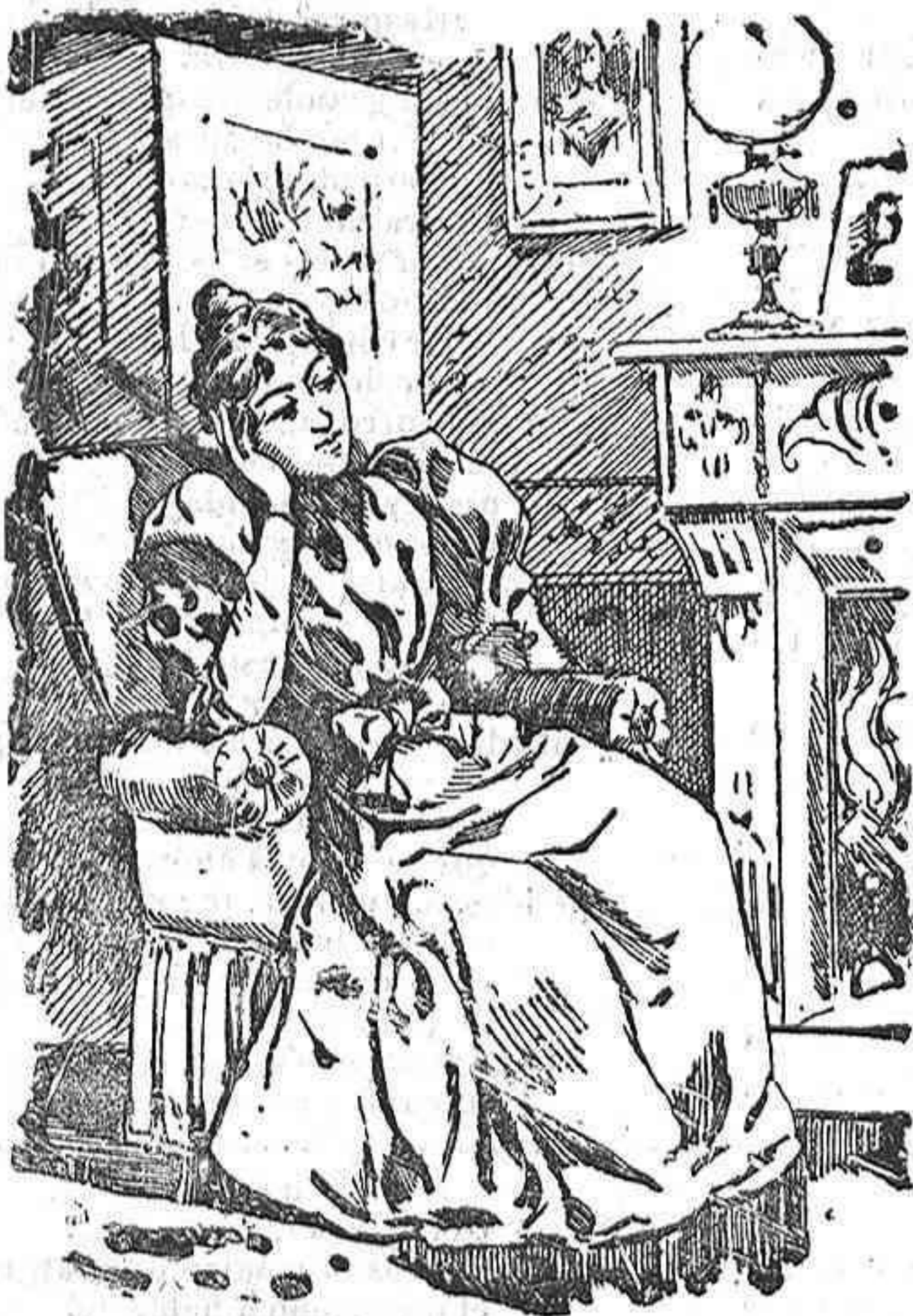
A los dos meses.