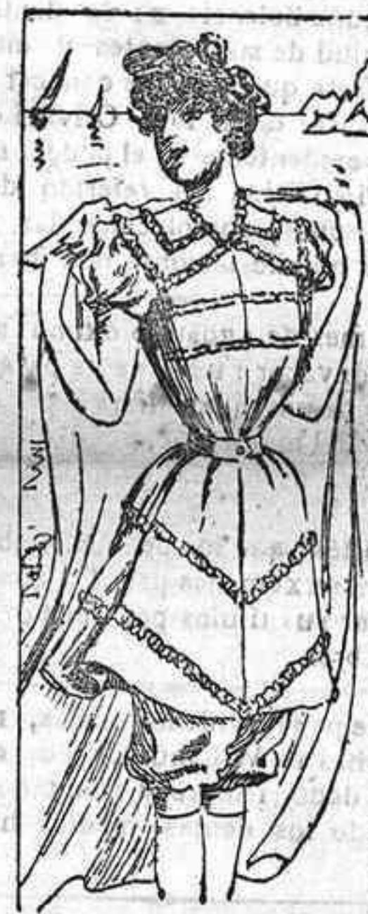
Traje para baño

po, figurando éste una airosa chaquetilla. Peto de batista blanca. Cuello y doblucuello con entredoses. Mangas estrechas. Falda acampanada con dos pequeños volantes en el borde y cinturón de seda.