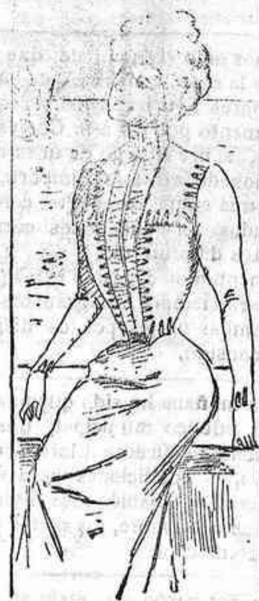
Traje para playa

Modelos exclusivos para nuestras lectoras, de los grandes almacenes de EL SIGLO, Barcelona.