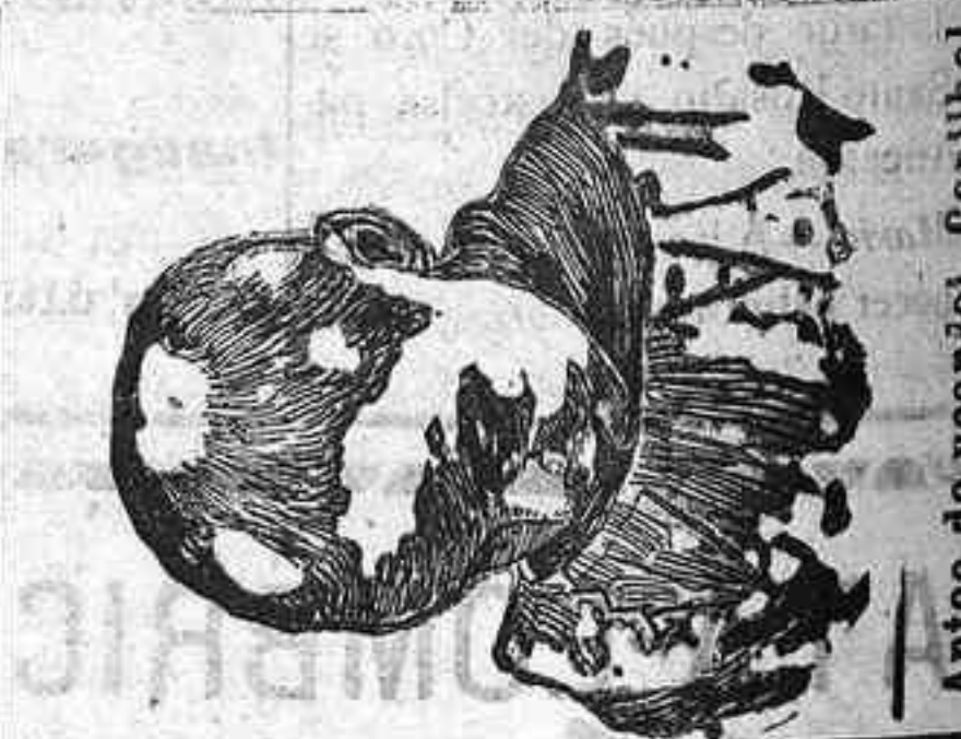
Antes de usar el Capilhol

CALVOS EL CAPILHOL ES INFALIBLE CONTRA LA CALVICIE ¡Pelado á los 30 años impide la caída de cabellos débiles