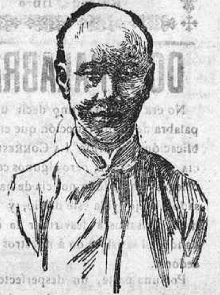
EL PRÍNCIPE CHUN Regente de China

Sin embargo de este precedente, hénese como cosa segura el triunfo de los chinos en la actual contienda.