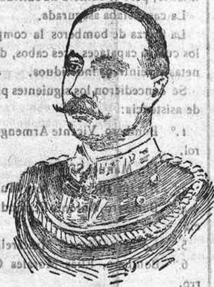
EL GENERAL SPINGARDI Ministro de la Guerra de Italia