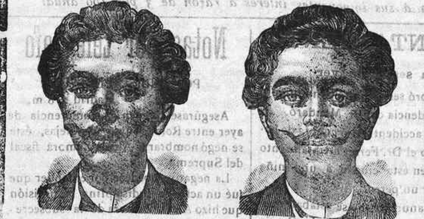
Antes de la curación. Después de 15 días de tratamiento.