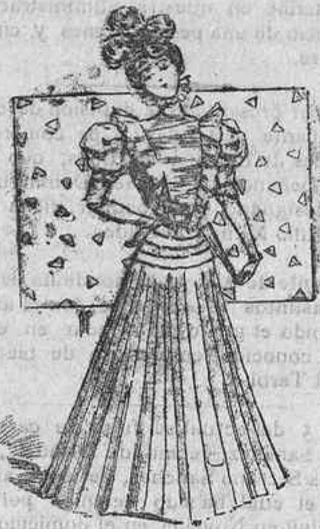
Traje para primavera

De seda pongees. Cuerpo de bengalina moaré, ajustado y abrochado á un lado. La tela de los delanteros vá recogida por un entredós de guipur, formando piezas. Cuello alto, mangas al biés y volante de encaje igual al del cuello; cinturón de guipur y falda acampanada con un volante á la inglesa en el borde.