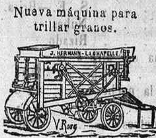
Nueva máquina para trillar granos.

Nuevas máquinas de harina sobre zocalo Boffeol de hierro.